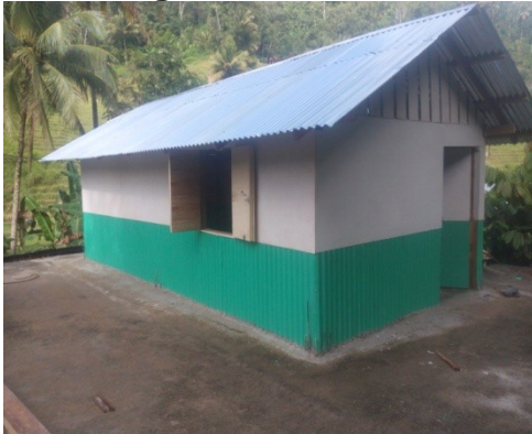
Loc. Dusun Guguk Palam Dana : Rp. 15.620.000,- (DD)