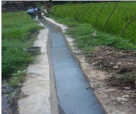
Loc. Dusun Koto Tuo Dana : Rp. 15.620.000,- (DD)