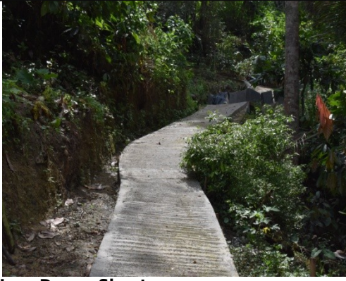
Loc. Dusun Simotuang Dana : Rp. 44.574.600,- (DD)