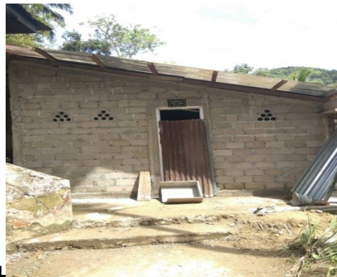
Loc. Dusun Guguk Palam Dana : Rp. 23.800.000,- (DD)