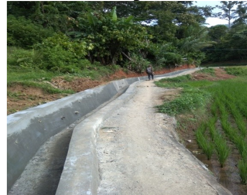
Loc. Dusun Koto Tuo Dana : Rp. 101.420.000,- (DD)