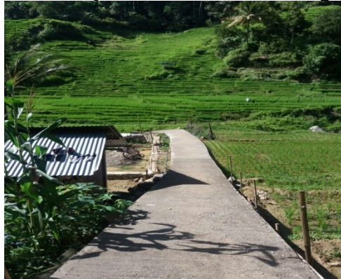
Loc. Dusun Guguk Palam Dana : Rp. 23.770.000,- (DD)