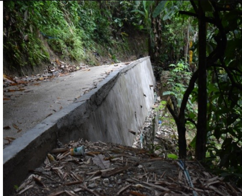
Loc. Dusun Simotuang Dana : Rp. 45.514.200,- (SILPA)