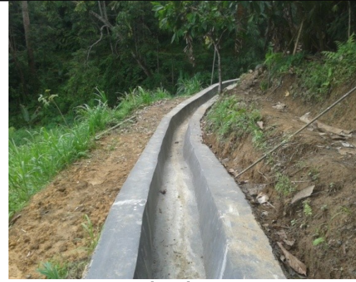
Loc. Dusun Guguk Palam Dana : Rp. 50.638.000,- (DD)