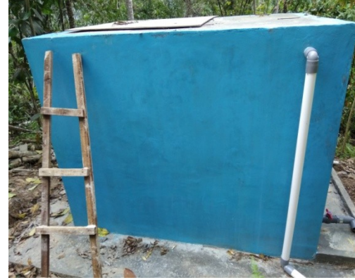
Loc. Dusun Tigo Tingka Dana : Rp. 81.669.000,- (DD)