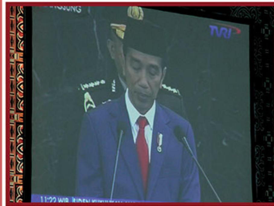
PRESIDEN REPUBLIK INDONESIA