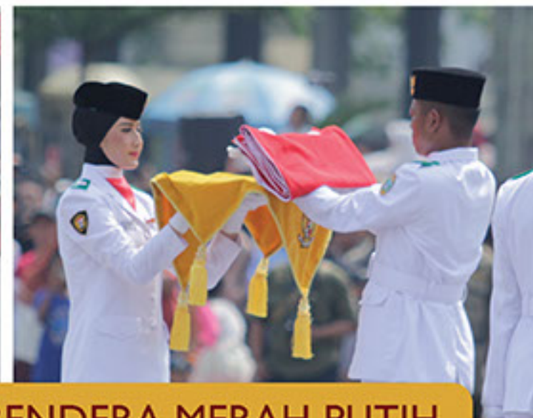
PROSESI PENGIBARAN BENDERA MERAH PUTIH LAPANGAN MERDEKA MEDAN, JUMAT 17 AGUSTUS 2018