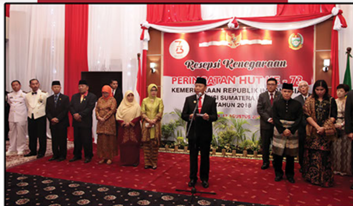
Pj. Gubernur Sumatera Utara Drs. Eko Subowo, MBA

"Kami menyampaikan berbagai proyek strategis nasional di Sumut antara lain kawasan pariwisata Danau Toba yang diharapkan menjadi Bali Baru. Pembangunan kawasan ekonomi khusus Sei Mangkei dan Pembangunan kawasan industri Kuala Tanjung yang diharapkan menjadi centres of accelerated industrialization di Indonesia"