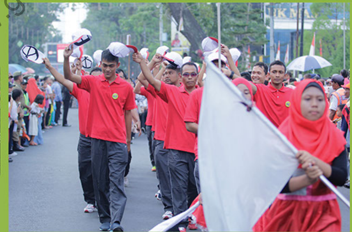
PESERTA PAWAI JALAN KAKI