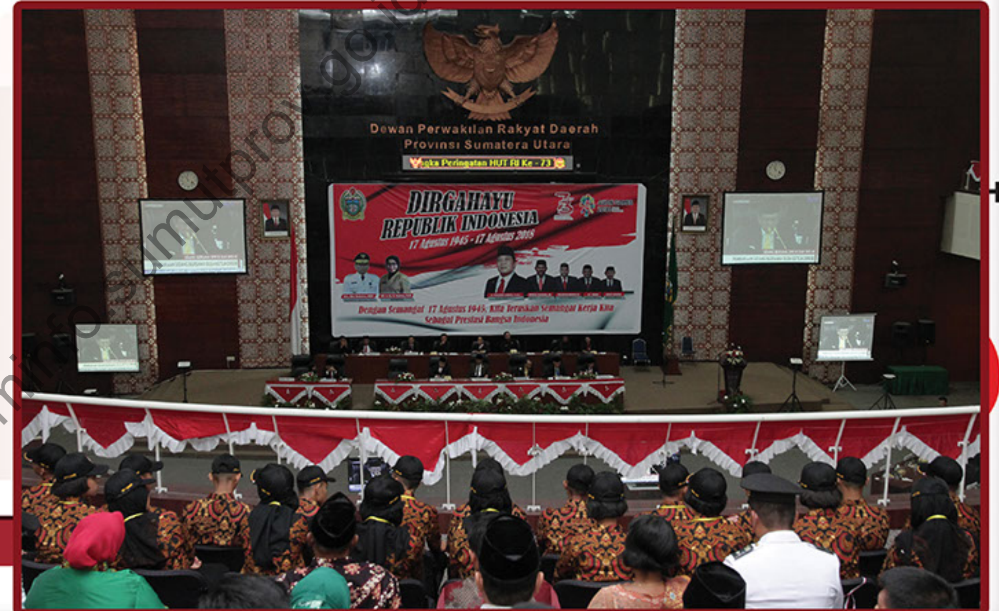
Ir. H. JOKO WIDODO