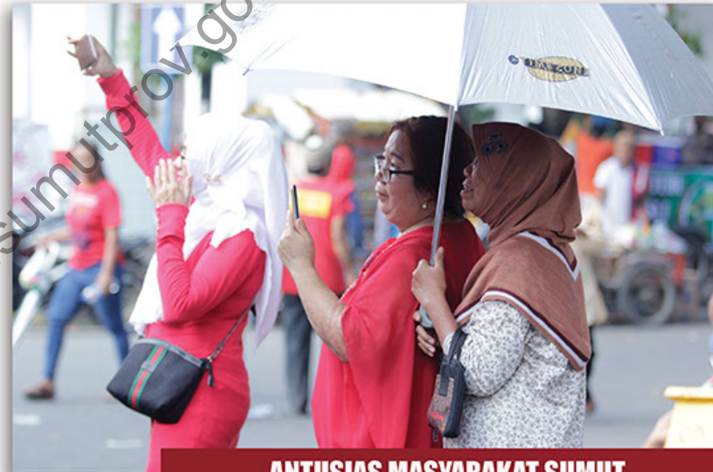
ANTUSIAS MASYARAKAT SUMUT SAAT MENYAKSIKAN PAWAI PEMBANGUNAN