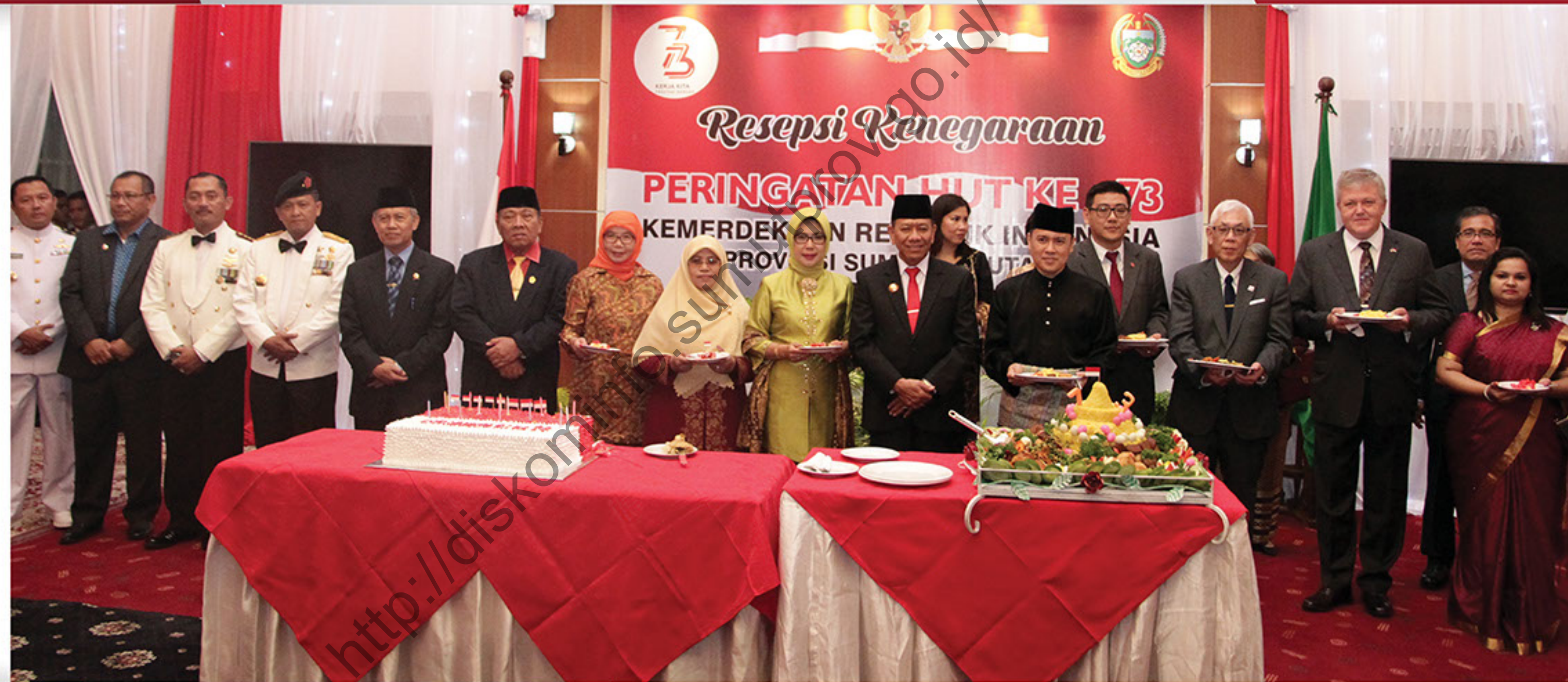
Foto Bersama Resepsi Kenegaraan HUT ke-73 RI Rumah Dinas Gubsu, Jumat 17 Agustus 2018