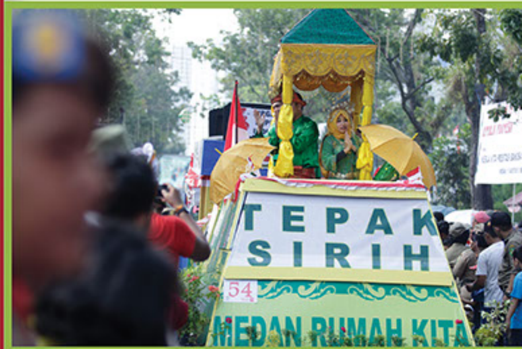
PESERTA PAWAI KENDARAAN MOBIL HIAS