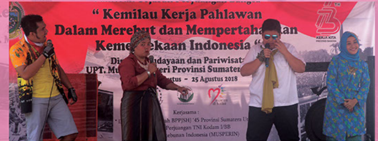
Penampilan Tari 8 Etnis Sumatera Utara dan Petra pada Pembukaan Pameran Sejarah Perjuangan Bangsa di Museum Negeri Sumatera Utara dalam rangka HUT ke-73 RI, Rabu 15 Agustus 2018