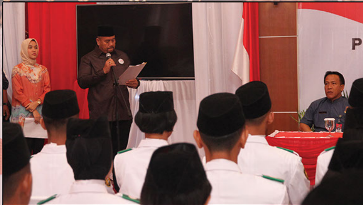
SUASANA PEMULANGAN PASKIBRAKA SUMUT