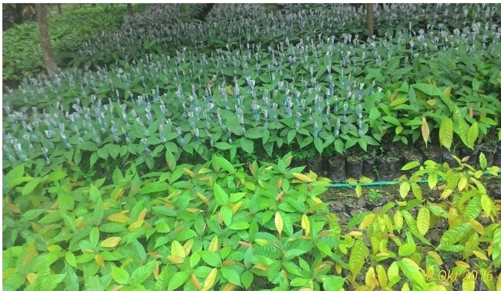
Dokumentasi Bibit Sambung Pucuk

Langkah strategis yang dilakukan untuk mengembalikan kejayaan produksi kakao adalah intensifikasi tanaman kakao, rehabilitasi tanaman kakao yang tua dan mengganti tanaman kakao dengan bibit sambung pucuk sesuai target visi misi Bupati Luwu timur yaitu rehabilitasi tanaman kakao.