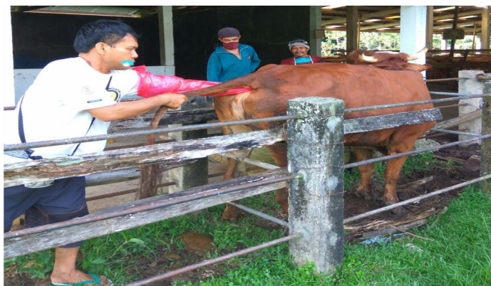
Dokumentasi kegiatan inseminasi buatan

Program/kegiatan yang menunjang pencapaian sasaran pertumbuhan populasi ternak besar, ternak kecil dan unggas antara lain :