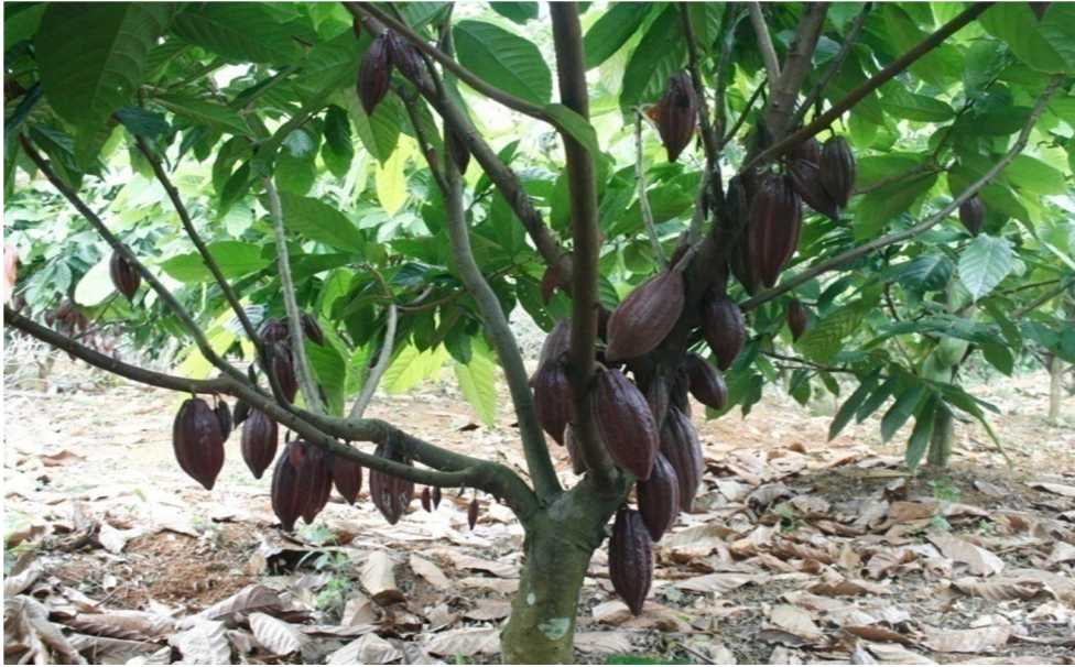
Dokumentasi tanaman kakao

Langkah strategis yang dilakukan untuk mengembalikan kejayaan produksi kakao adalah intensifikasi tanaman kakao, rehabilitasi tanaman kakao yang tua dan mengganti tanaman kakao dengan bibit sambung pucuk sesuai target visi misi Bupati Luwu timur yaitu rehabilitasi tanaman kakao.