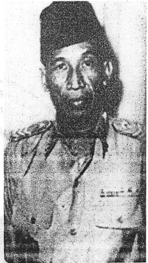
Dr. H. Soemarno Sosroatmodjo

Dr. Soemarno Sosroatmodjo lahir di Rambipuji, Jember Jawa Timur pada tanggal 24 April 1911. Beliau adalah salah satu mantan Gubernur DKI Jakarta yang pernah menjabat dalam dua periode yaitu periode 1960–1964 dan periode 1965–1966. Selain berasal dari militer ia juga adalah seorang dokter. Sebelum zaman Kemerdekaan, ia pernah menjadi direktur Rumah Sakit Hanggulan Sinta yang berlokasi di kampung Barimba, kecamatan Kapuas Hilir, Kabupaten Kapuas, Kalimantan Tengah pada tahun 1939.