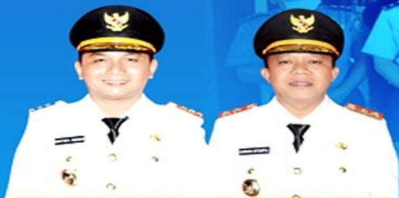
BAKHTIAR AHMAD SIBARANI BUPATI TAPANULI TENGAH

UPDATE DATA PASIEN PADA TANGGAL 17 APRIL 2020