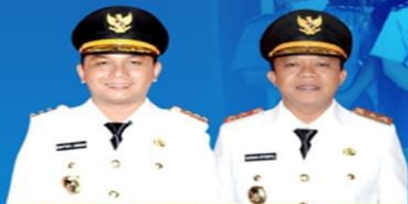
BAKHTIAR AHMAD SIBARANI BUPATI TAPANULI TENGAH

UPDATE DATA PASIEN PADA TANGGAL 23 APRIL 2020