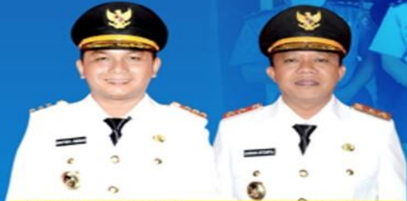
BAKHTIAR AHMAD SIBARANI BUPATI TAPANULI TENGAH

UPDATE DATA PASIEN PADA TANGGAL 6 MEI 2020