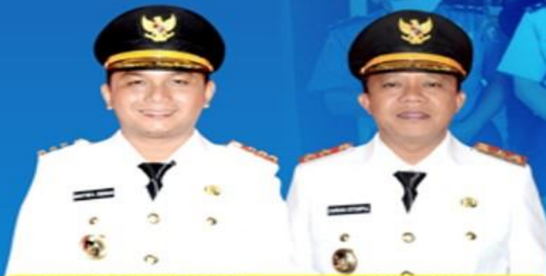
BAKHTIAR AHMAD SIBARANI BUPATI TAPANULI TENGAH

UPDATE DATA PASIEN PADA TANGGAL 17 MEI 2020