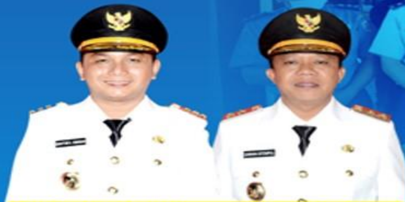
BAKHTIAR AHMAD SIBARANI BUPATI TAPANULI TENGAH

UPDATE DATA PASIEN PADA TANGGAL 24 MEI 2020