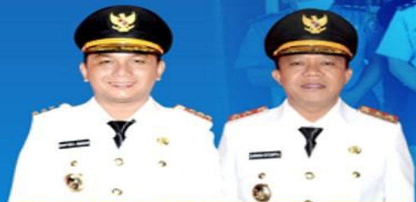
BAKHTIAR AHMAD SIBARANI BUPATI TAPANULI TENGAH

UPDATE DATA PASIEN PADA TANGGAL 29 JUNI 2020