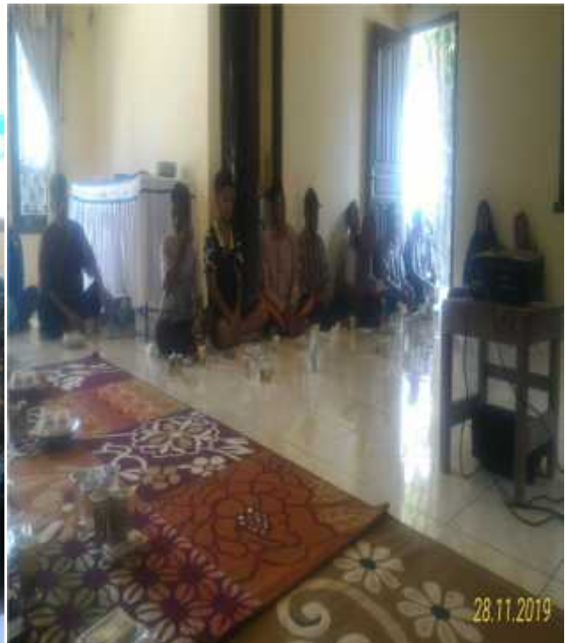
Kegiatan sosialisasi terkait peraturan perundang-undangan yang mengatur tentang penggunaan alat tangkap ikan yang terlarang bagi kelompok nelayan di Kabupaten Kotawaringin Barat yang dilaksanakan pada hari Kamis, 28 November 2019 di Desa Kanambui. Peserta kegiatan terdiri dari 30 nelayan