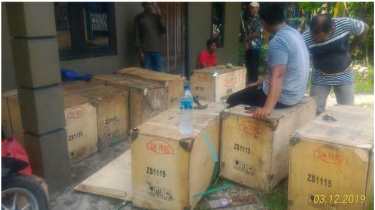
Bantuan Mesin 23 PK Untuk KUB Bahari Desa Sebuai dan KUB Aneka Ds. Sei Bakau Tahun 2019