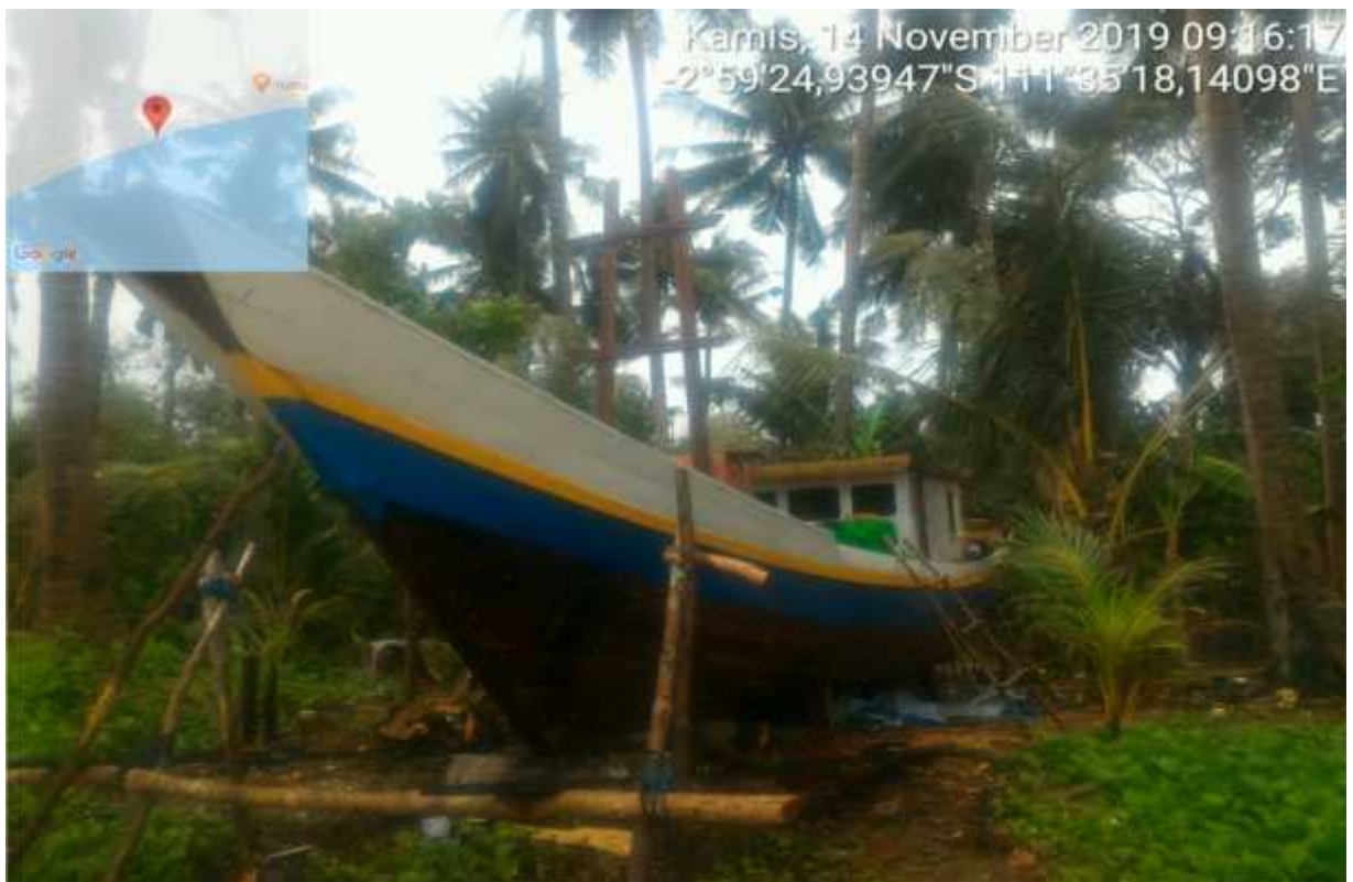
Bantuan Kapal <5GT untuk KUB Bakau Indah Desa Sei Bakau Tahun 2019