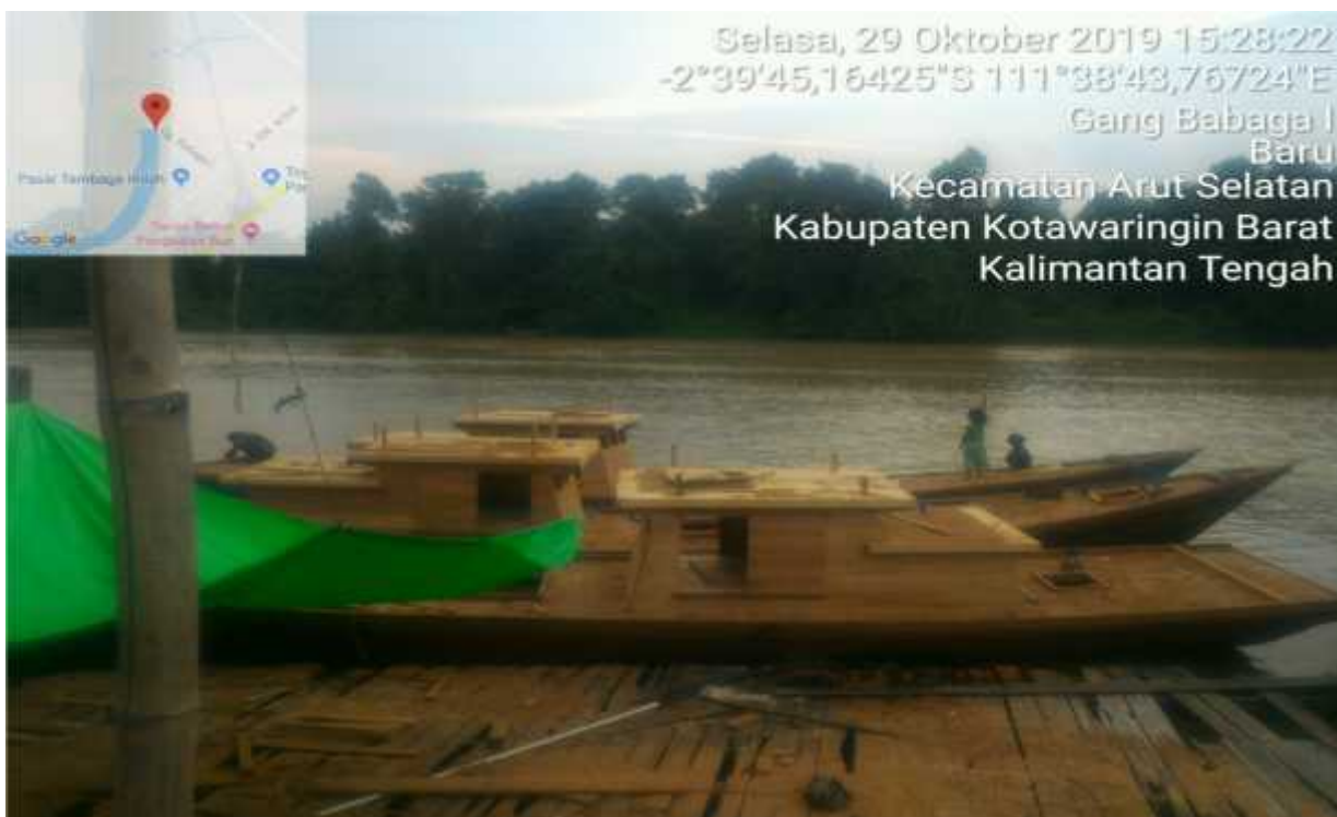
Bantuan Kapal <3 GT yang bersumber dari Dana DAK Bagi 10 KUB Penerima Hibah