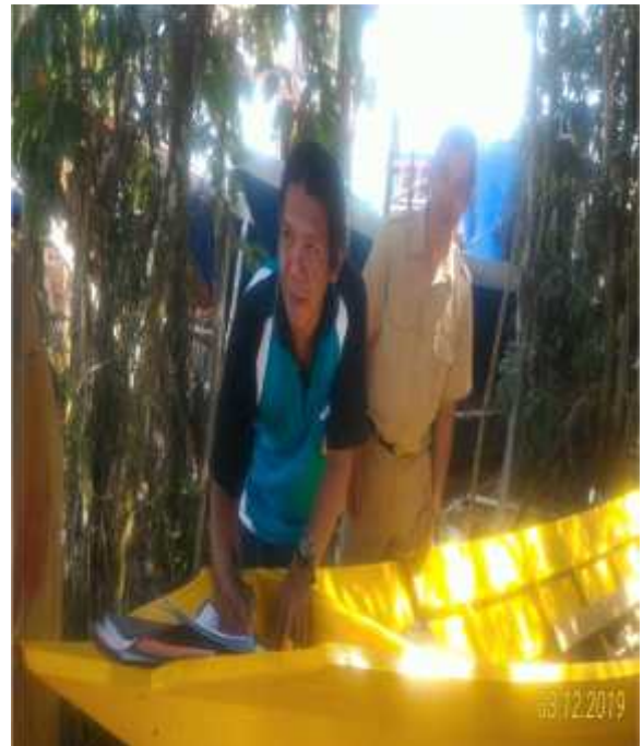
Bantuan Kapal 1GT untuk KUB Mendawai Bina Utama Sejahtera dan KUB Mendawai Bina Lestari Sejahtera Kelurahan Mendawai masing-masing sebanyak 2 Unit