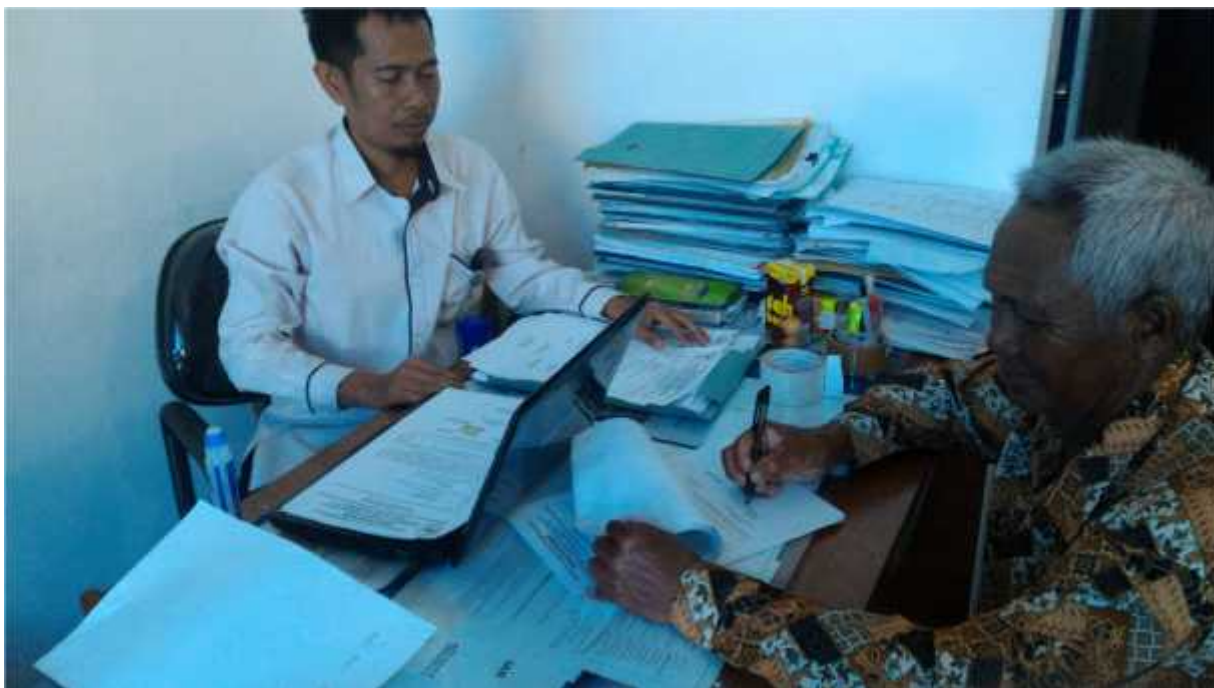
Penandatanganan NPHP, Pakta Integrias dan BAST Serah Terima Hasil Pekerjaan Kepada kepada salah satu Kelompok Penerima Hibah Tahun 2019