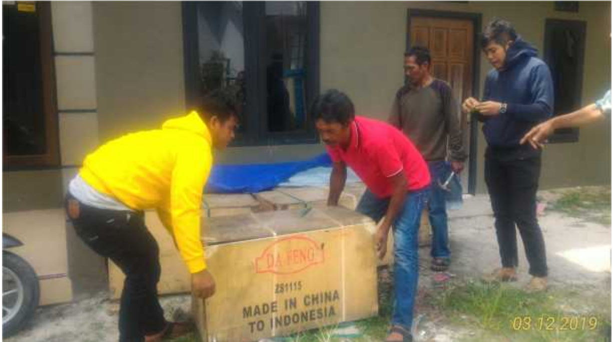
Bantuan Mesin 23 PK Untuk KUB Bahari Desa Sebuai dan KUB Aneka Ds. Sei Bakau Tahun 2019