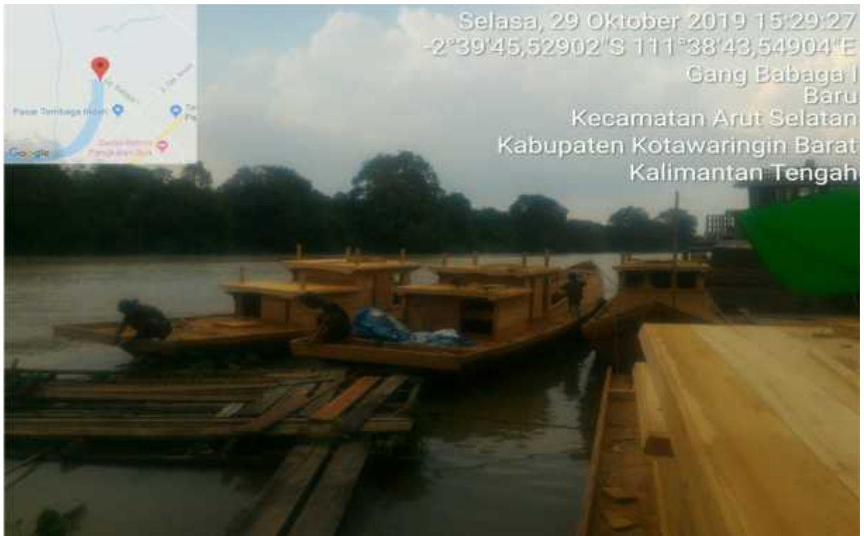
Bantuan Kapal <3 GT yang bersumber dari Dana DAK Bagi 10 KUB Penerima Hibah