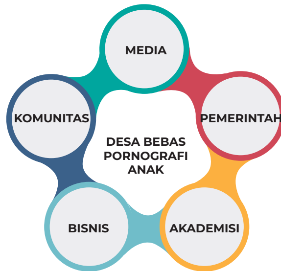
Pengembangan Desa Bebas Pornografi

Untuk memastikan keberlanjutan desa bebas pornografi anak dapat berjalan dalam jangka panjang, diperlukan relasi kemitraan pemangku kepentingan wilayah untuk mengoptimalkan peran dan tugasnya dalam mewujudkan desa bebas pornografi anak. Sehingga, di masa mendatang, program-program Desa Bebas Pornografi tidak hanya bergantung pada pemerintah, namun merupakan program hasil relasi kemitraan dari berbagai pemangku kepentingan. Dalam pendekatan kontemporer, relasi kemitraan pentahelix A-B-C-G-M (Academic, Business, Community, Government, Media) menjadi kunci dalam mewujudkan desa bebas pornografi anak.