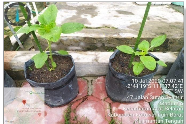
Tanaman Bunga Matahari yang ditanam di media tanah menggunakan polybag