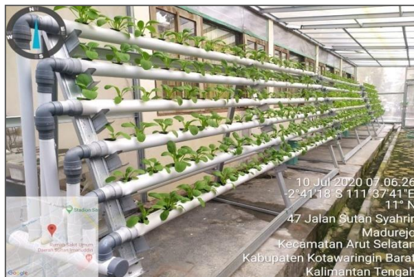
Kondisi Tanaman Sawi Sendok ( Pakcoy ) dan Sawi Keriting ( Samhong )