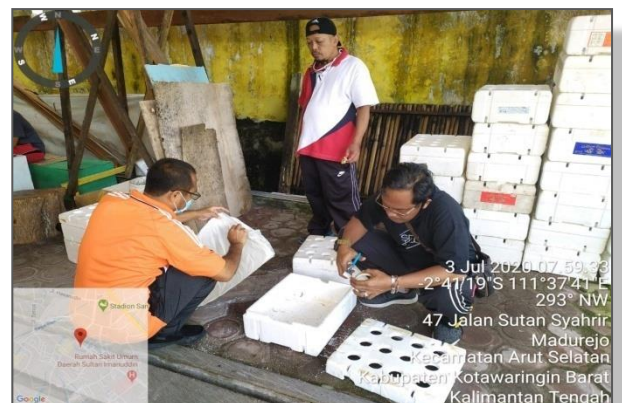
ASN DKP Kab. Kotawaringin Barat melakukan kegiatan penyiapan rangkaian hidroponik