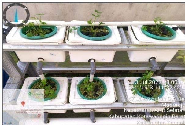
Perkembangan Tanaman Seledri pada rangkaian hidroponik