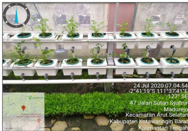
Perkembangan Tanaman Seledri pada rangkaian hidroponik