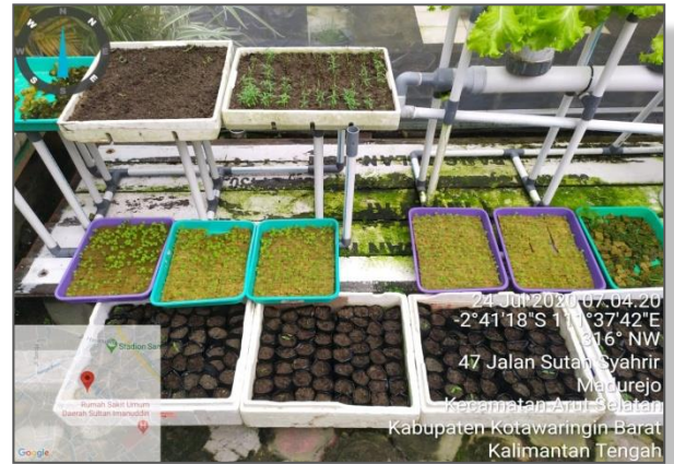
Perkembangan tanaman Seledri pada rangkaian hidroponik