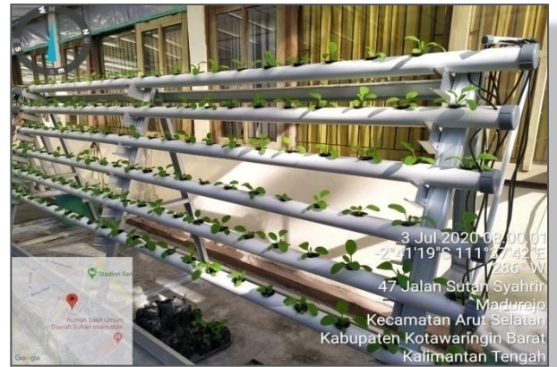
Kondisi tanaman Sawi Sendok ( Pakcoy ) (umur tanaman 3 minggu)