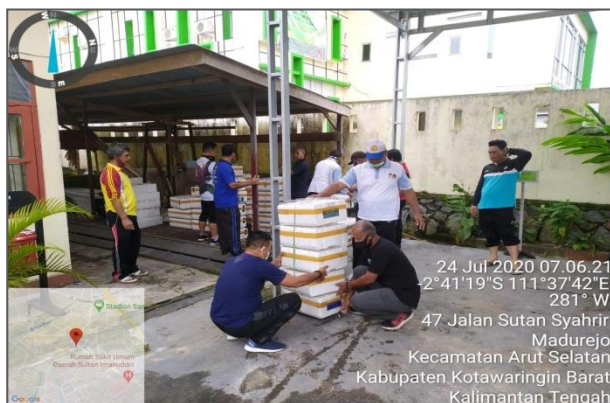
Pengepakan Starter Kit Tanaman Hidroponik untuk bantuan ke Kel. Raja Seberang