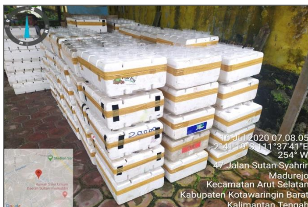
Penyiapan starter kit rangkaian hidroponik untuk Kegiatan Penanganan Stunting