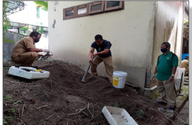
Kegiatan penyiapan media tanam untuk kegiatan bantuan bibit ke masyarakat