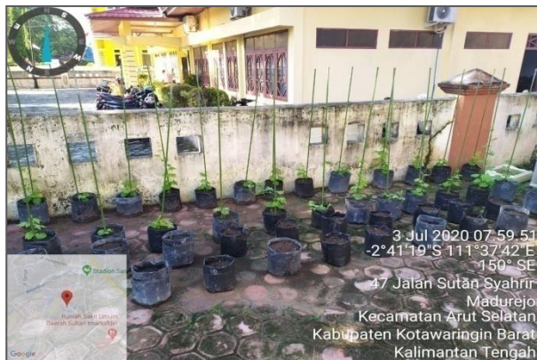
Kondisi Kegiatan OPAL DKP Kab. Ktw. Barat per tanggal 03 Juli 2020