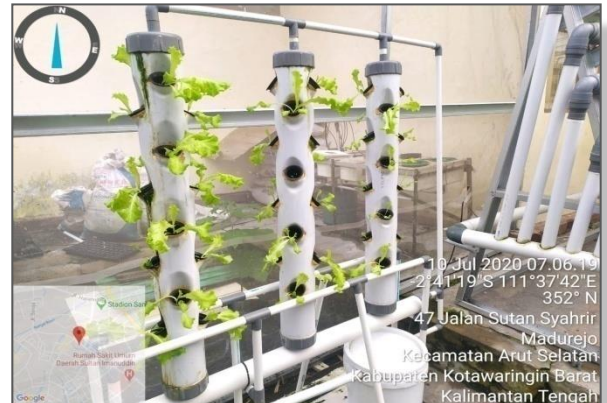
Perkembangan Tanaman Sawi Keriting pada rangkaian hidroponik berdiri