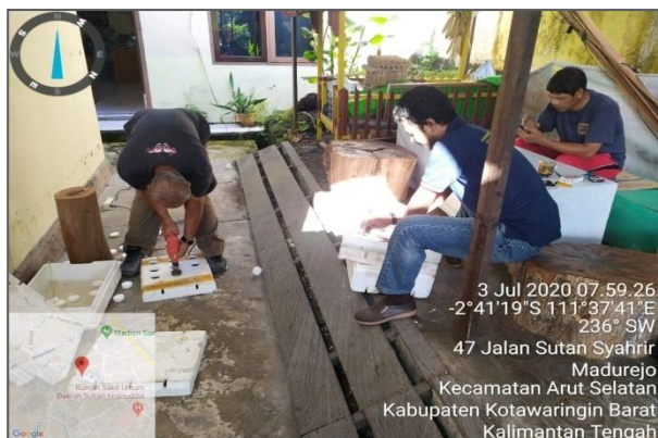
ASN DKP Kab. Kotawaringin Barat melakukan kegiatan penyiapan rangkaian hidroponik