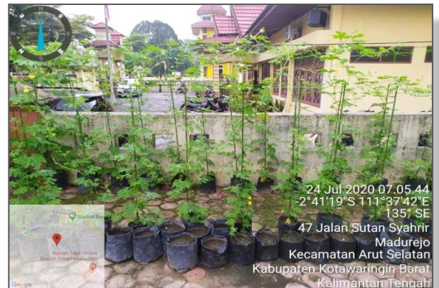
Tanaman Pare yang ditanam di media tanah menggunakan polybag