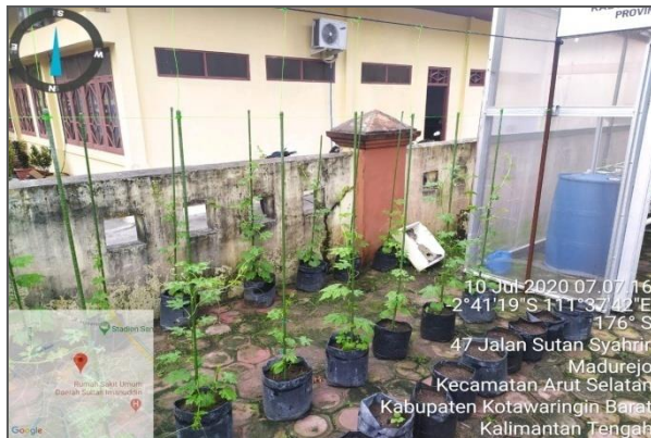
Tanaman Pare yang ditanam di media tanah menggunakan polybag