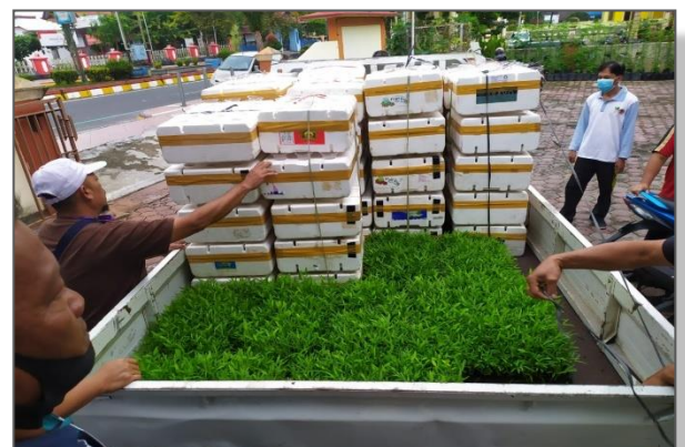
Pengepakan Starter Kit Tanaman Hidroponik untuk bantuan ke Kel. Raja Seberang