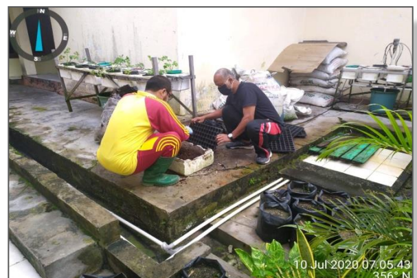
Penyiapan bibit tanaman untuk Kegiatan Penanganan Stunting