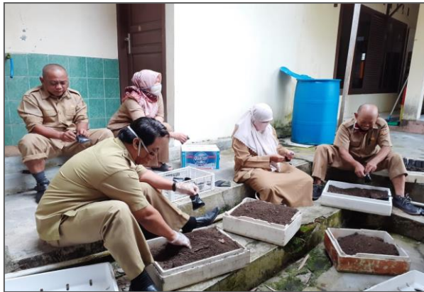
Kegiatan penyiapan media tanam untuk kegiatan bantuan bibit ke masyarakat