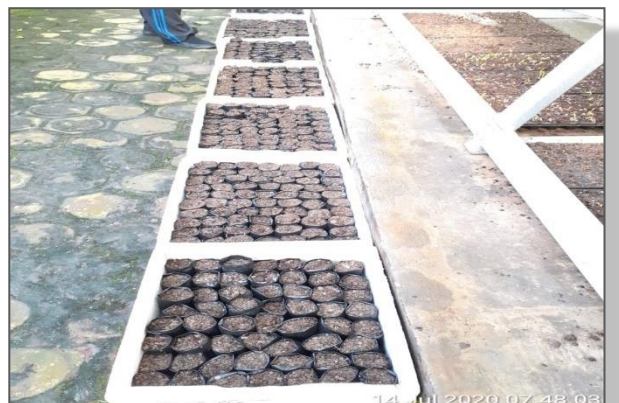
Kegiatan penyemaian benih untuk kegiatan bantuan bibit ke masyarakat