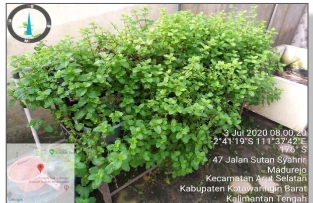
Kondisi Tanaman Daun Mint pada rangkaian Hidroponik