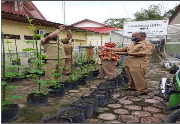
Tanaman Pare yang ditanam di media tanah menggunakan polybag