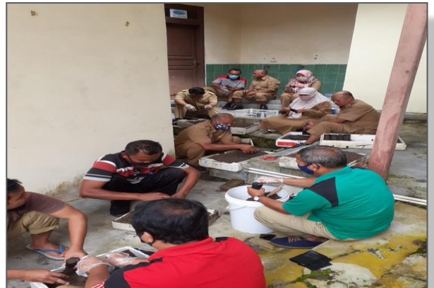
Kegiatan penyiapan media tanam untuk kegiatan bantuan bibit ke masyarakat