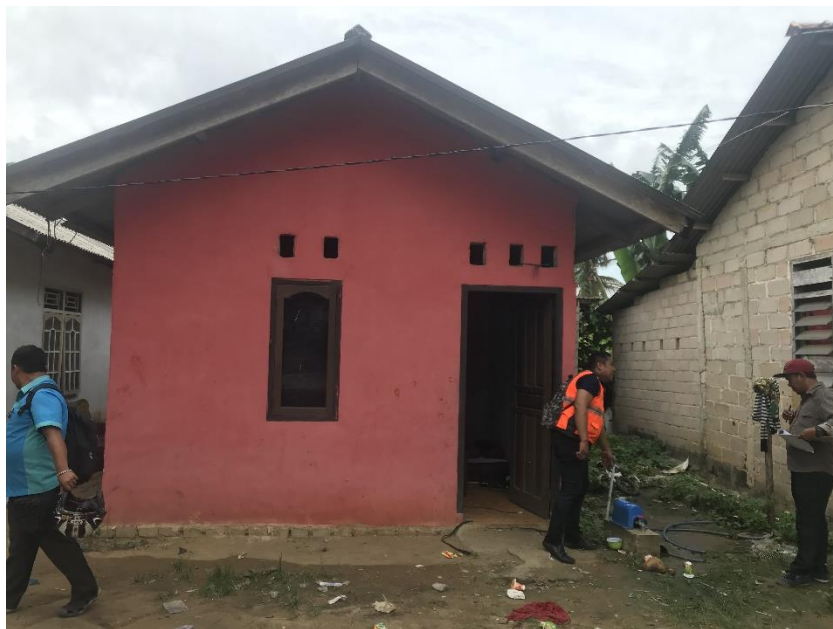
Gambar 2. Pemeriksaan pekerjaan bersama dengan Penyedia Jasa dan Tim Direksi PDAM Tirta Sejiran Setason