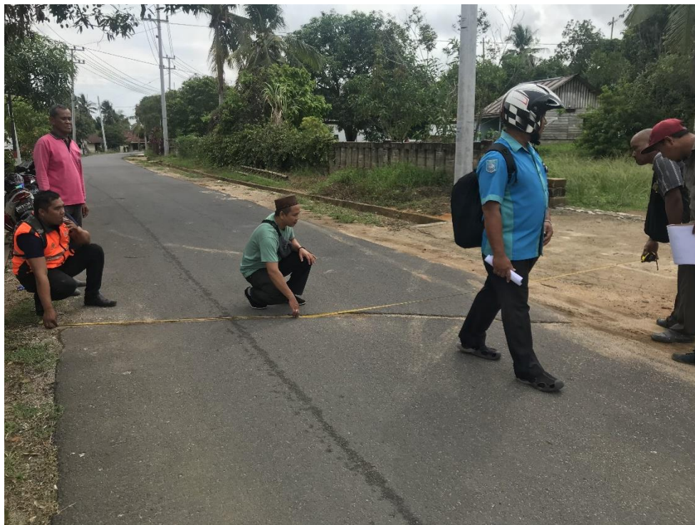
Gambar 1. Pemeriksaan pekerjaan bersama dengan Penyedia Jasa dan Tim Direksi PDAM Tirta Sejiran Setason