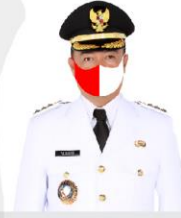
YULHAIDIR Bupati Seruyan Setahu Ketua Satuan Tugas Penanganan Covid-19 Kabupaten Seruyan