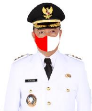
YULHAIDIR Bupati Seruyan Setahu Ketua Satuan Tugas Penanganan Covid-19 Kabupaten Seruyan