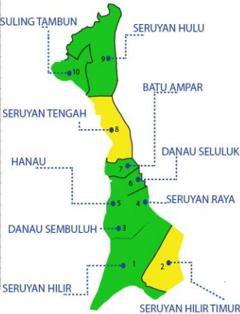
Keterangan warna Peta