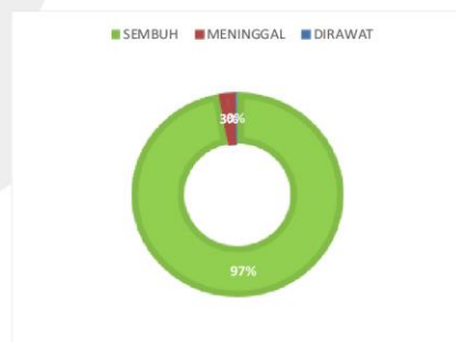
PERSENTASE KONDISI PASIEN COVID-19 KABUPATEN SERUYAN

sumber data : Dinas Kesehatan Kabupaten Seruyan