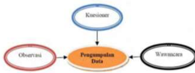
Gambar 3.1 Alur Tringulasi Teknik Data