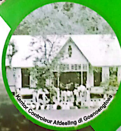
Kantor Controleur Afdeeling di Goenoengtoea