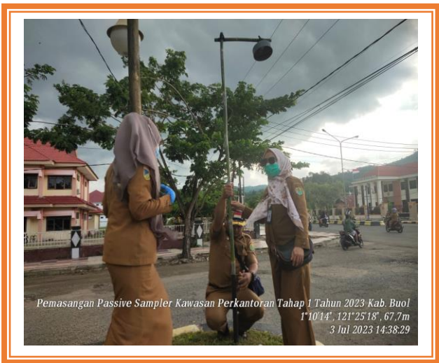
Pemasangan Passive Sampler Kawasan Perkantoran Kabupaten Buol