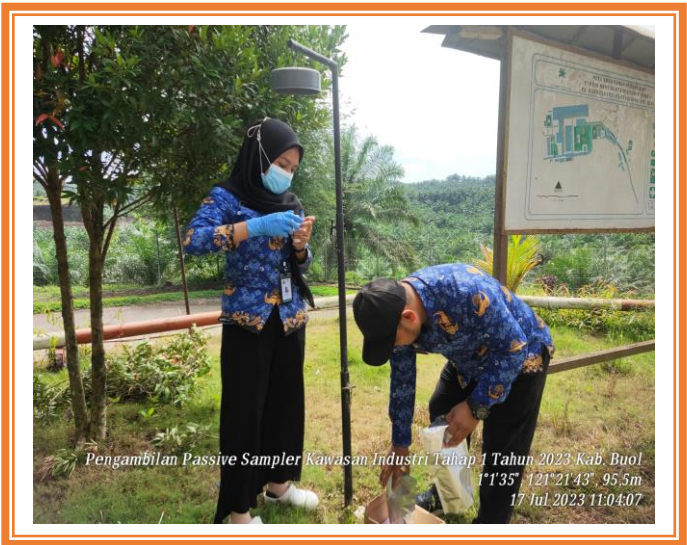
Pengambilan Passive Sampler Kawasan Industri Kabupaten Buol