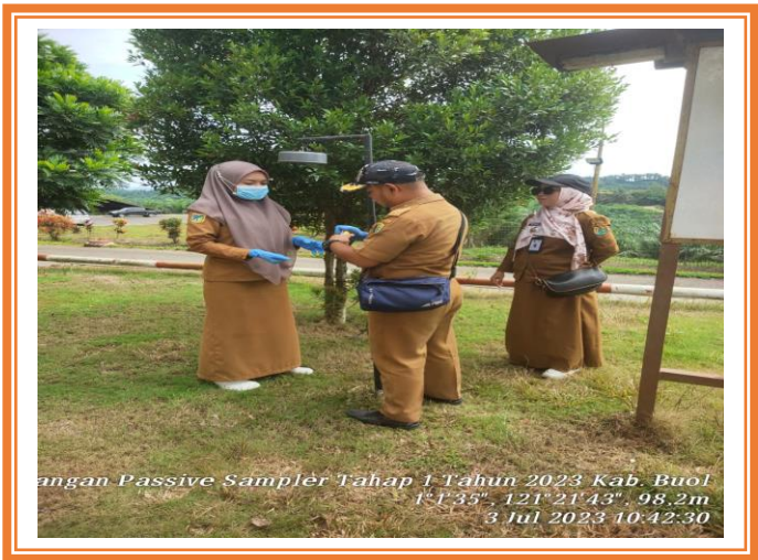
Pemasangan Passive Sampler Kawasan Industri Kabupaten Buol