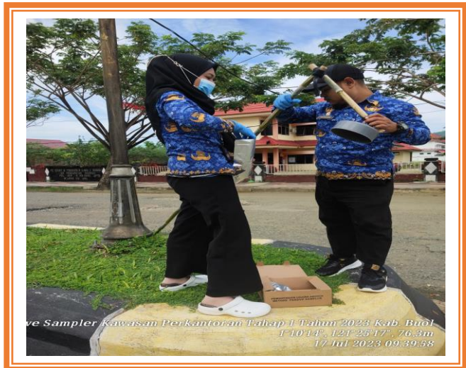
Pengambilan Passive Sampler Kawasan Perkantoran Kabupaten Buol