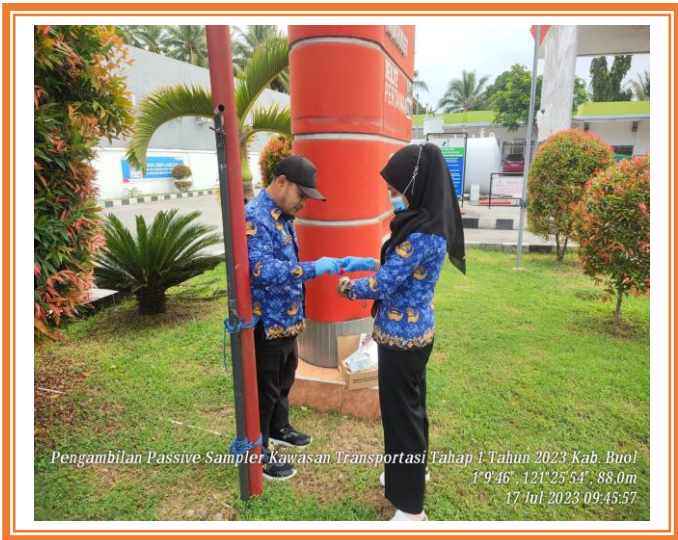
Pengambilan Passive Sampler Kawasan Transportasi Kabupaten Buol

3. Pemantauan udara ambien dengan metode passive sampler Kawasan Permukiman Kabupaten Buol dengan data sebagai berikut :