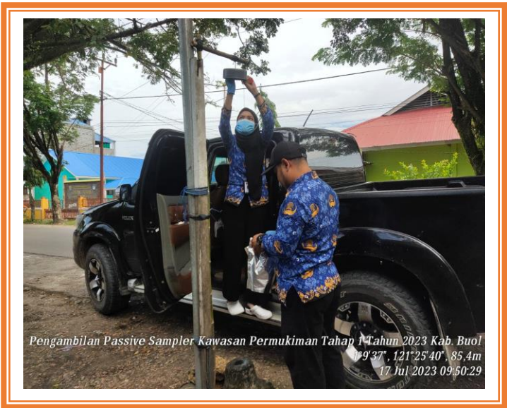
Pengambilan Passive Sampler Kawasan Permukiman Kabupaten