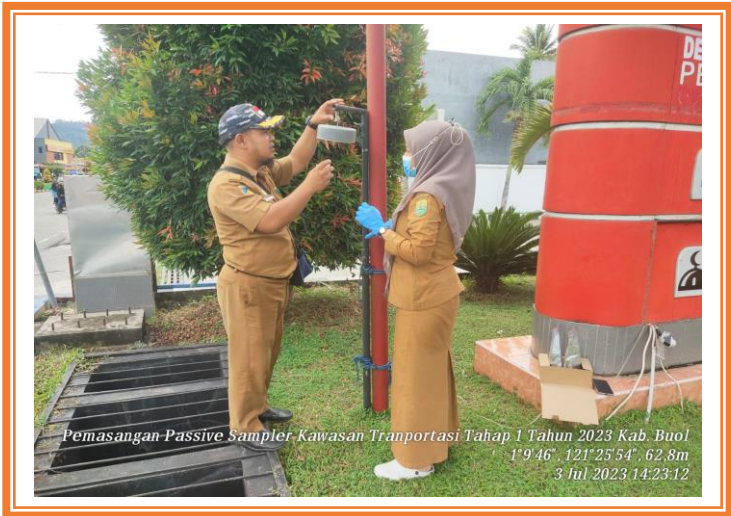
Pemasangan Passive Sampler Kawasan Transportasi Kabupaten Buol