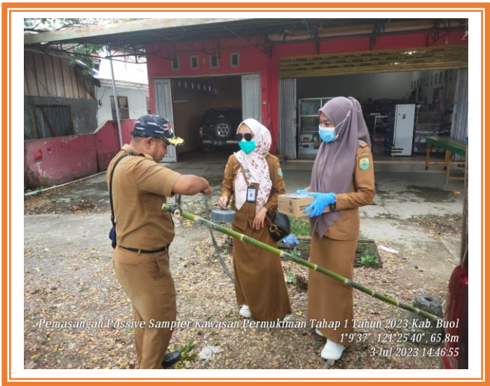
Pemasangan Passive Sampler Kawasan Permukiman Kabupaten