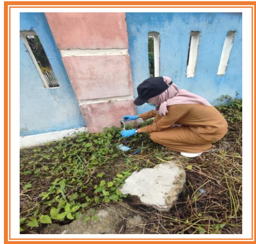
Sampling Limbah Cair dan Air hygiene UPTD Rumah Sakit Mokoyurli Kecamatan Biau Kabupaten Buol