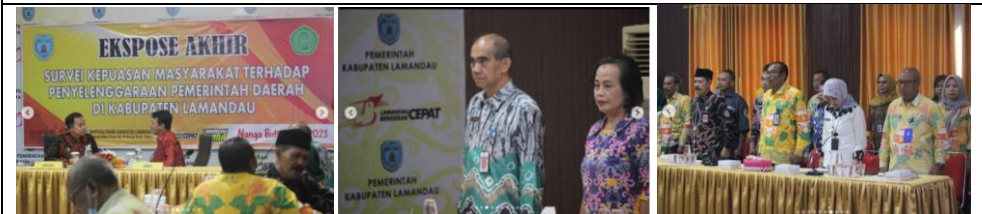
Ekspose Akhir Survei Kepuasan Masyarakat Terhadap Penyelenggaraan Pemerintah Daerah di Kabupaten Lamandau Tahun 2023