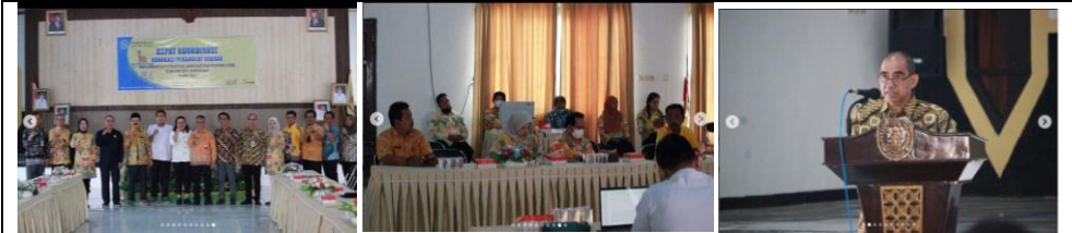
Rapat Koordinasi Advokasi Perangkat Daerah, Implementasi Strategi Sanitasi Kabupaten (SSK) Kab. Lamandau Tahun 2023