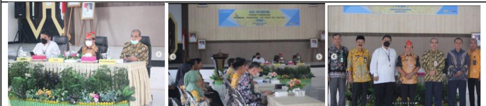
Kick-off Meeting Program Pembangunan, Perumahan, Pemukiman Air Minum dan Sanitasi (PPAS) Kabupaten Lamandau Tahun 2023