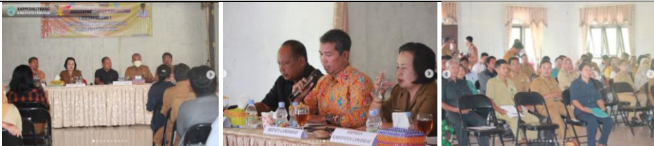
Musrenbang RKPD Tahun 2024 tingkat kecamatan di Kecamatan Batang Kawa