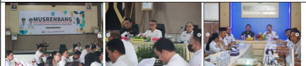
Musrenbang RKP Kabupaten Lamandau Tahun 2024