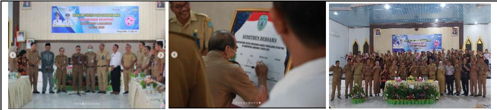
Rembuk Stunting dan Lokakarya Mini Penurunan Stunting Kab. Lamandau Tahun 2023