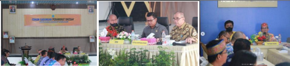
Forum Gabungan Perangkat Daerah Kabupaten Lamandau Tahun 2023