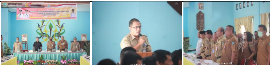
Musrenbang RKPD Tahun 2024 tingkat kecamatan di Kecamatan Delang