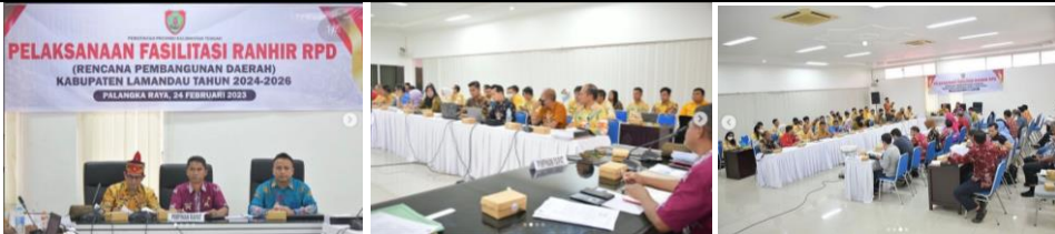
Fasilitasi Rancangan Akhir Rencana Pembangunan Daerah (RPD) 2024-2026 di Bappedalitbang Provinsi Kalimantan Tengah