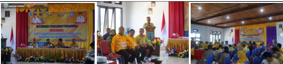
Musrenbang RKPD Tahun 2024 tingkat kecamatan di Kecamatan Belantikan Raya