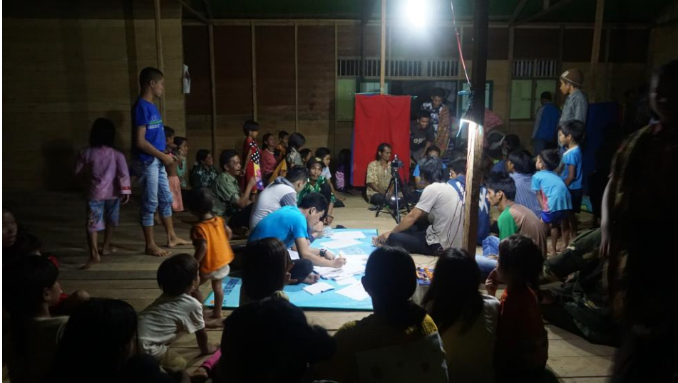
Gambar pelaksanaan DEWA CINTA di Libaru Sungkai.

DEWA CINTA berasal dari akronim Dokumen Kependudukan Warga Terpencil yang Terlayani. DEWA CINTA merupakan inovasi yang dilakukan oleh Dinas Kependudukan dan Pencatatan Sipil Kabupaten Balangan sejak tahun 2016. Inovasi ini dilakukan sebagai respon atas rendahnya kepemilikan dokumen kependudukan pada daerah-daerah terpencil di Kabupaten Balangan.