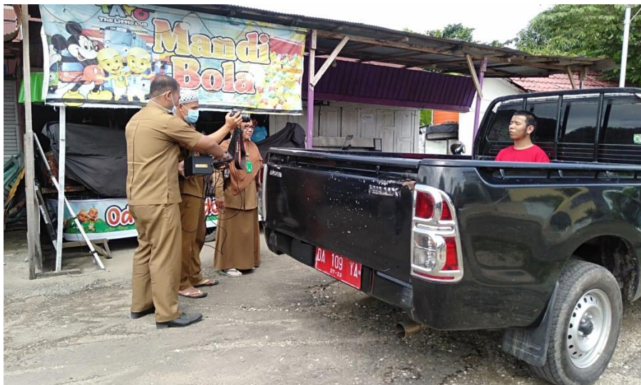
Gambar Perekaman KTP-el penduduk mengalami keterbelakangan mental.

HATI UNDA merupakan akronim Hanyar Tilpon, Ulun Datang . Sebuah inovasi yang dilakukan oleh Dinas Kependudukan dan Pencatatan Sipil Kabupaten Balangan sejak tahun 2015 guna memberikan kemudahan perekaman KTP elektronik yang dikhususkan untuk penduduk yang mengalami sakit, kelumpuhan, disabilitas, gangguan kejiwaan, dan masalah lainnya. Dengan adanya inovasi HATI UNDA, penduduk yang mengalami kekurangan tersebut tidak perlu harus datang ke tempat perekaman KTP-el di