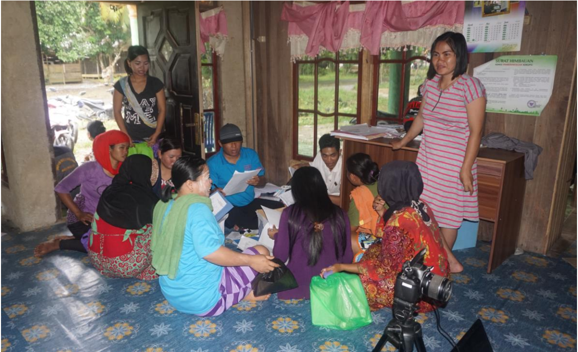
Gambar pelayanan jemput bola di desa Uren.

Guna percepatan capaian kepemilikan dokumen kependudukan di Kabupaten Balangan, Dinas Kependudukan dan Pencatatan Sipil membuat inovasi Jemput di Desa. Jemput di Desa merupakan layanan yang dilakukan secara jemput bola di desa-desa. Seluruh dokumen kependudukan dapat diurus dalam pelaksanaan inovasi ini. Dengan adanya inovasi ini maka penduduk dapat mengurus dokumen kependudukannya di dalam pelayanan jemput bola di desa. Manfaat lain yang diperoleh dari inovasi ini adalah percepatan pencapaian target cakupan kepemilikan dokumen kependudukan.