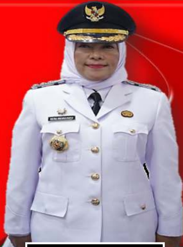
HERA NUGRAHAYU PJ. Walikota Palangka Raya