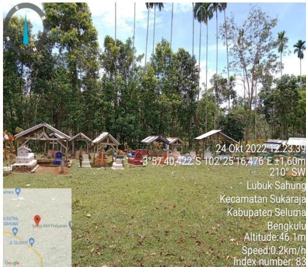
PHOTO PEMAKAMAN DAN FASILITAS UMUM LAINNYA DI KELURAHAN SUKARAJA, KECAMATAN SUKARAJA KABUPATEN SELUMA