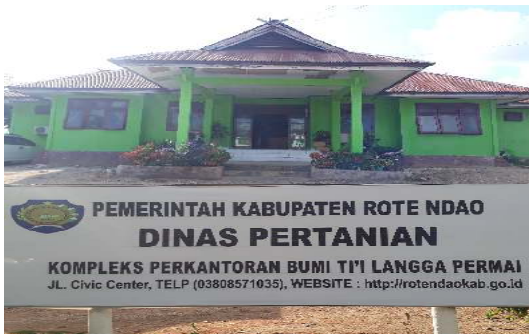
Kantor Dinas Pertanian Kabupaten Rote Ndao