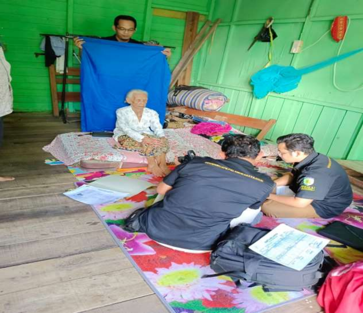
PENDAMPINGAN PEMBUATAN ADMINDUK PDM