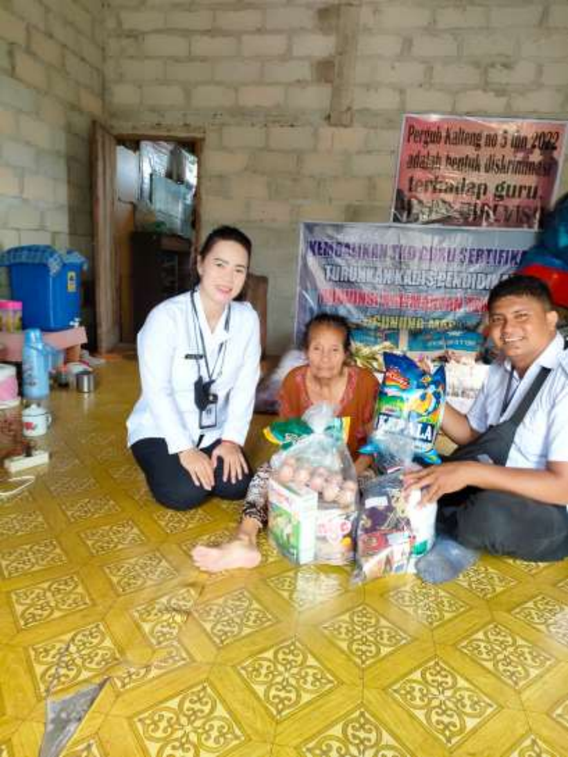
PELAYANAN PENGANTARAN PEMBERIAN ALAT BANTU UNTUK ANAK DISABILITAS OELH PETUGAS