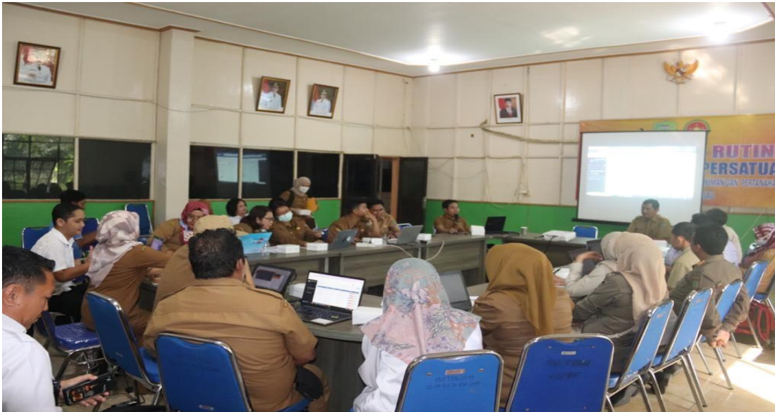
Rapat koordinasi pengisian Self Assessment Questionnaire (SAQ) Monev Keterbukaan Informasi Publik di wilayah Provinsi Kalimantan Tengah Tahun 2023