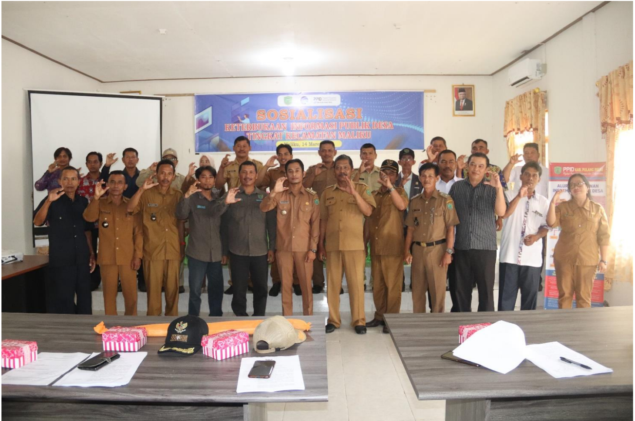
Sosialisasi Keterbukaan Informasi Publik Desa di Kecamatan Maluku 14 Maret 2023