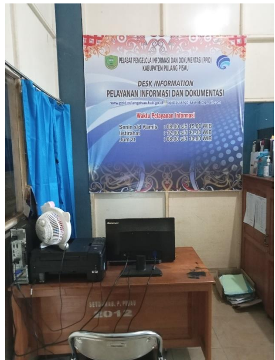
Desk Informasi Sarana dan Prasarana Pelayanan Informasi Publik PPID Utama Kabupaten Pulang Pisau