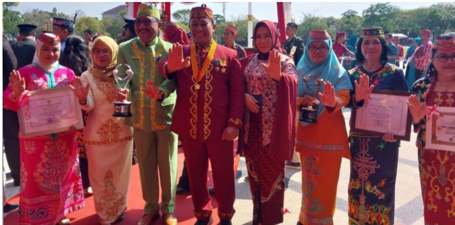
PENGHARGAAN : Pemerintah Kabupaten Kapuas melalui Dinas Pemberdayaan Perempuan, Perlindungan Anak, Pengendalian Penduduk dan Keluarga Berencana (DP3APPKB) Kabupaten Kapuas memperoleh Penghargaan KLA Kategori Pratama di Palangka Raya