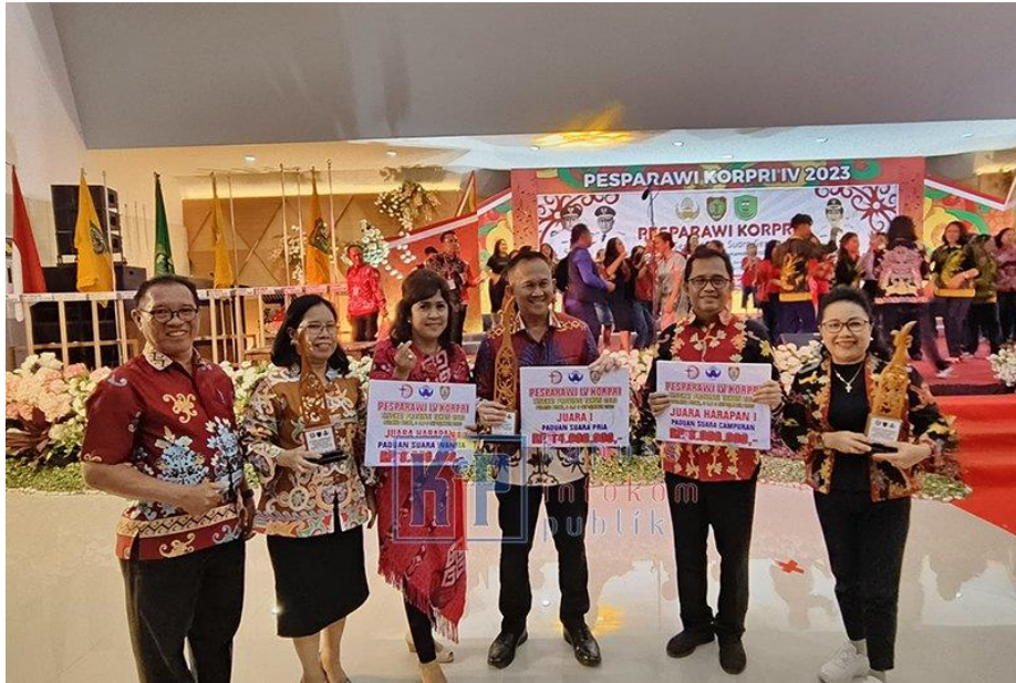
Korpri Kabupaten Kapuas berhasil meraih sejumlah juara pada Pekan Seni Paduan Suara Gerejawi (Pesparawi) IV KORPRI Tingkat Provinsi Kalteng Tahun 2023 yang dilaksanakan di Kabupaten Pulang Pisau