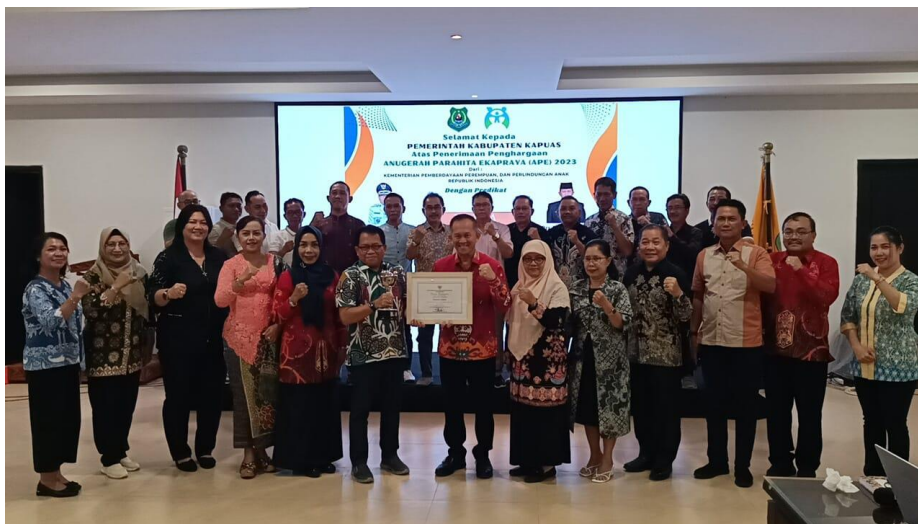
Kegiatan penyerahan penghargaan Anugerah Parahita Ekapraya 2023 ke Pemkab Kapuas, di Ruang Rapat Rujab Bupati Kapua