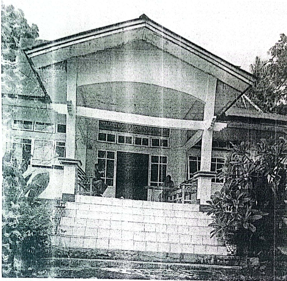
KANTOR CAMAT LEWOLEMA TAHUN 2023