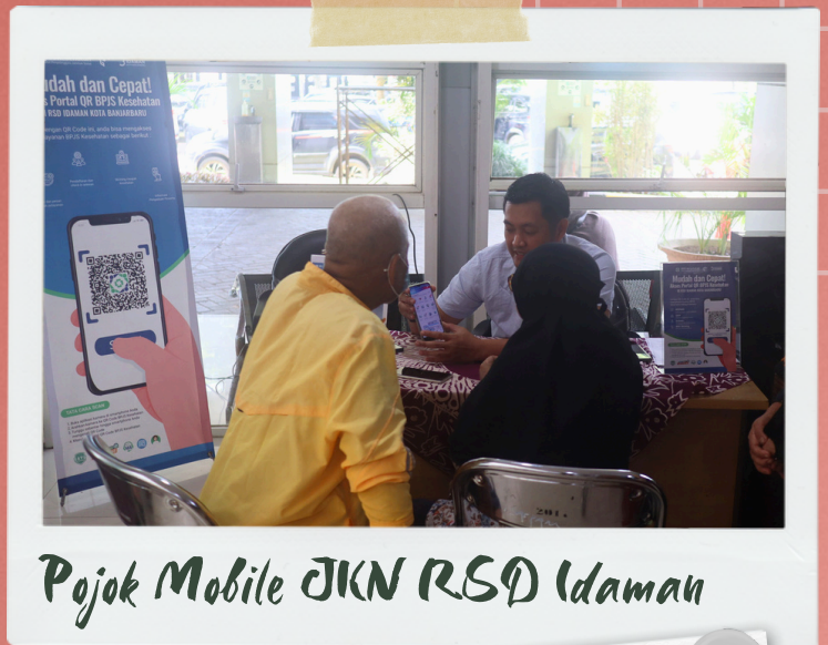
Pojok Mobile JKN RSD Idaman

Bagi pengunjung RSD Idaman yang ingin menginstal aplikasi Mobile JKN, konsultasi ataupun mengalami kendala.