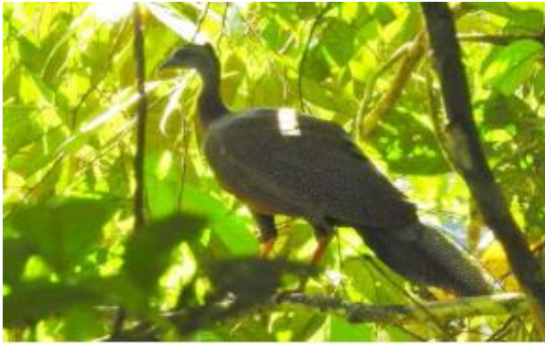
Burung Ruai / Kuau