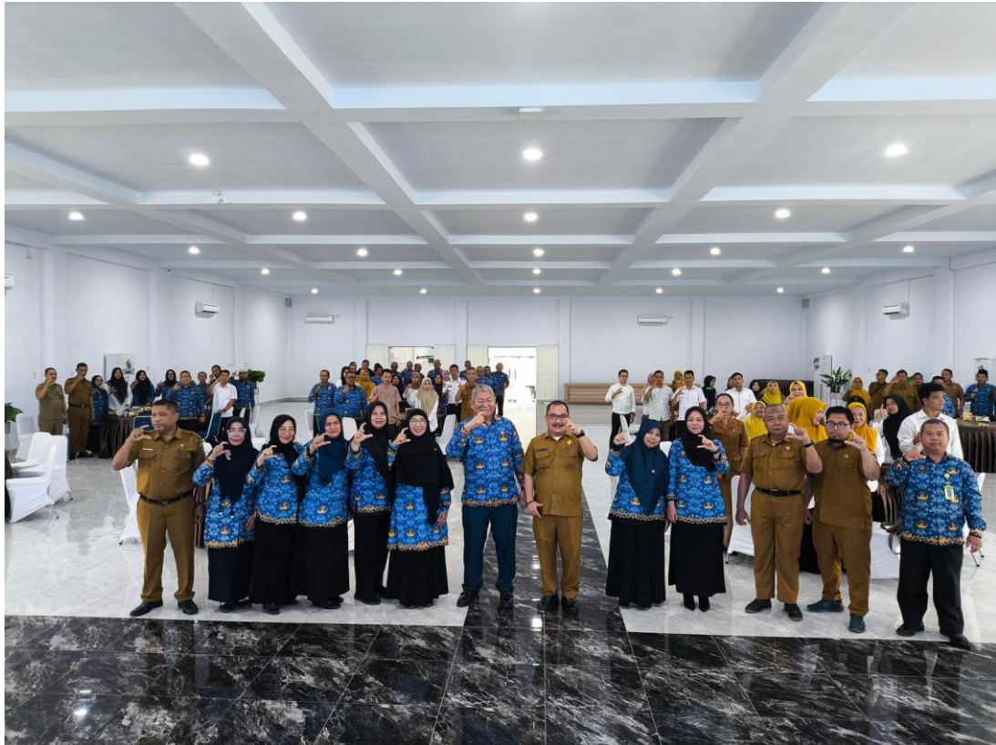
Dokumentasi Pertemuan Pejabat Pengelola Informasi dan Dokumentasi (PPID) Pemerintah Kabupaten Asahan