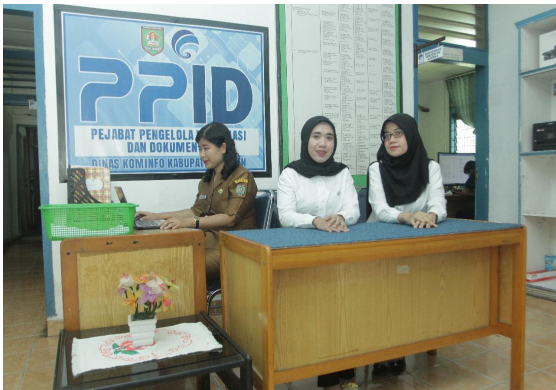
Sarana dan Prasarana PPID di Kabupaten Asahan