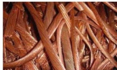
TEMBAGA Jenis Besi Keterangan : Tembaga Tebal, Tembaga Tipis/Serabut Contoh Barang : Tembaga Kabel Sutet, Tembaga Isian Kabel