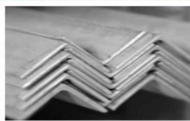
ALUMINIUM SIKU Jenis Besi Keterangan : Aluminium Keras Berbentuk Siku Contoh Barang : Bingkai Etalase