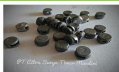
TIMAH Jenis Besi Keterangan : Timah Padat Contoh Barang : Timah Bekas Dari Pelak Mobil, Dari Aki Bekas