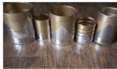
KALENG Jenis Besi Keterangan : Jenis Kaleng Lebih Tipis dari Besi dan Jika ditempelkan Magnet Menempel Contoh Barang : Kaleng Susu, Kaleng Biskuit, Seng