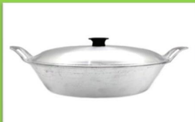
ALUMINIUM PANGCI Jenis Besi Keterangan : Aluminium Berbentuk Pangi Contoh Barang : Pangi, Barang Dapur