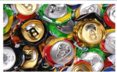
ALUMINIUM KRE Jenis Besi Keterangan : Aluminium Berbentuk Gelas Contoh Barang : Kemasan Minuman Bersoda, Minuman Penyegar