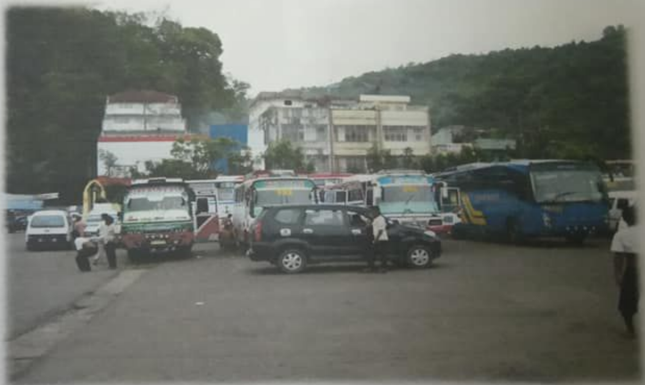
Dok. 2 Kesibukan di Terminal Bus Sibolga