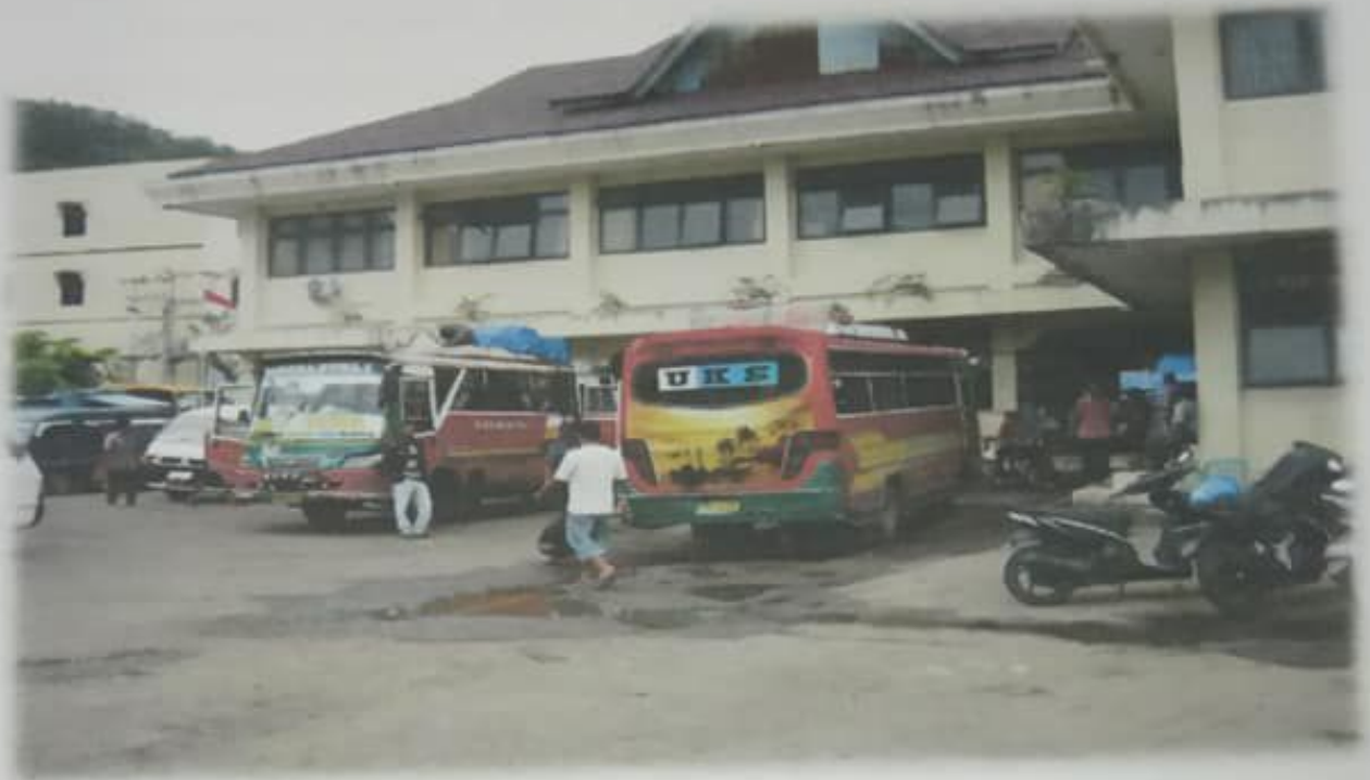
Dok. 1 Kondisi Terminal Bus Sibolga