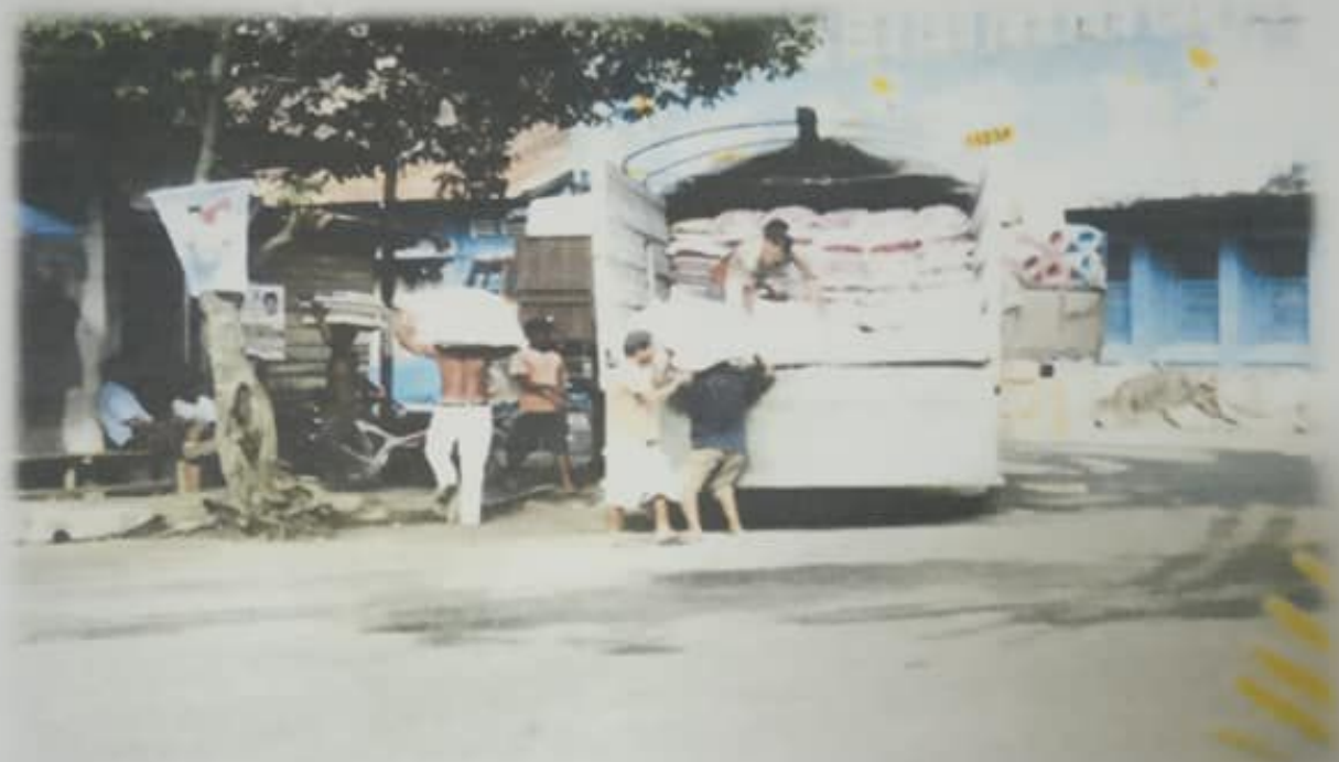
Dok. 3 Situasi disaat pengangkut komoditi sedang melakukan pembongkaran.

Perusahaan pengangkutan juga tersedia untuk mendukung aktifitas pengiriman barang seperti: Three Star, Bukit Berbunga, Bunga berbunga, Tapanuli Express, dan lain-lain.