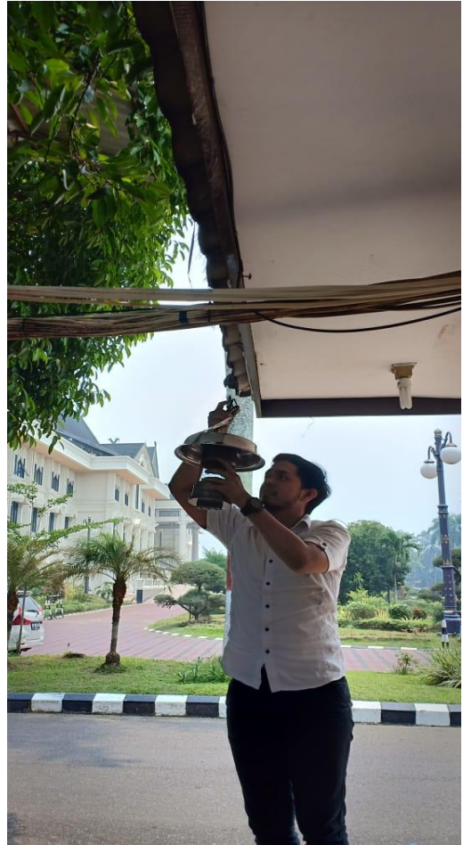
Pengambilan alat di lokasi perkantoran Kota Jambi