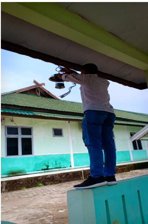
Pengambilan alat di lokasi perkantoran Kabupaten Muaro Jambi