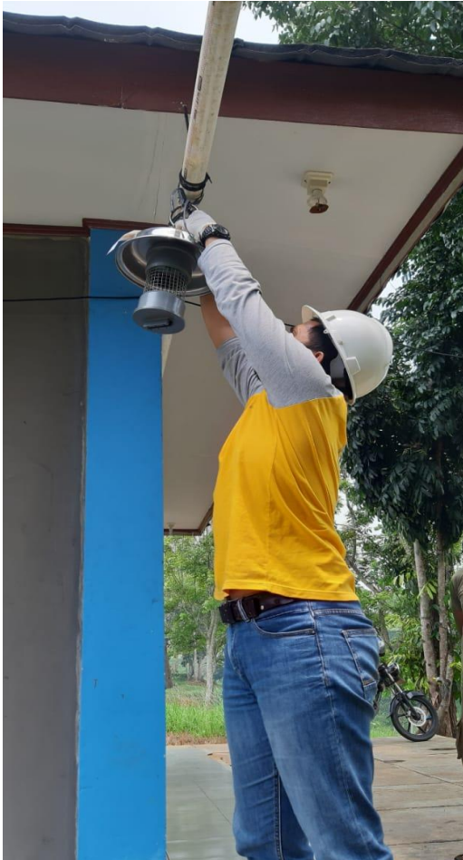
Pengambilan alat di perumahan Kabupaten Tanjung Jabung Timur