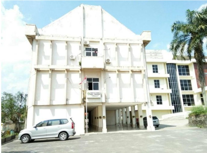
Gambar 2. Kantor Dinas Pendidikan dan Kebudayaan Kota Prabumulih

Alamat Kantor Dinas Pendidikan dan Kebudayaan Kota Prabumulih : Jl. Jenderal Sudirman No. 1 Kota Prabumulih Sumatera Selatan Kode Pos 31121 Telp / Fax : (0713) 321490