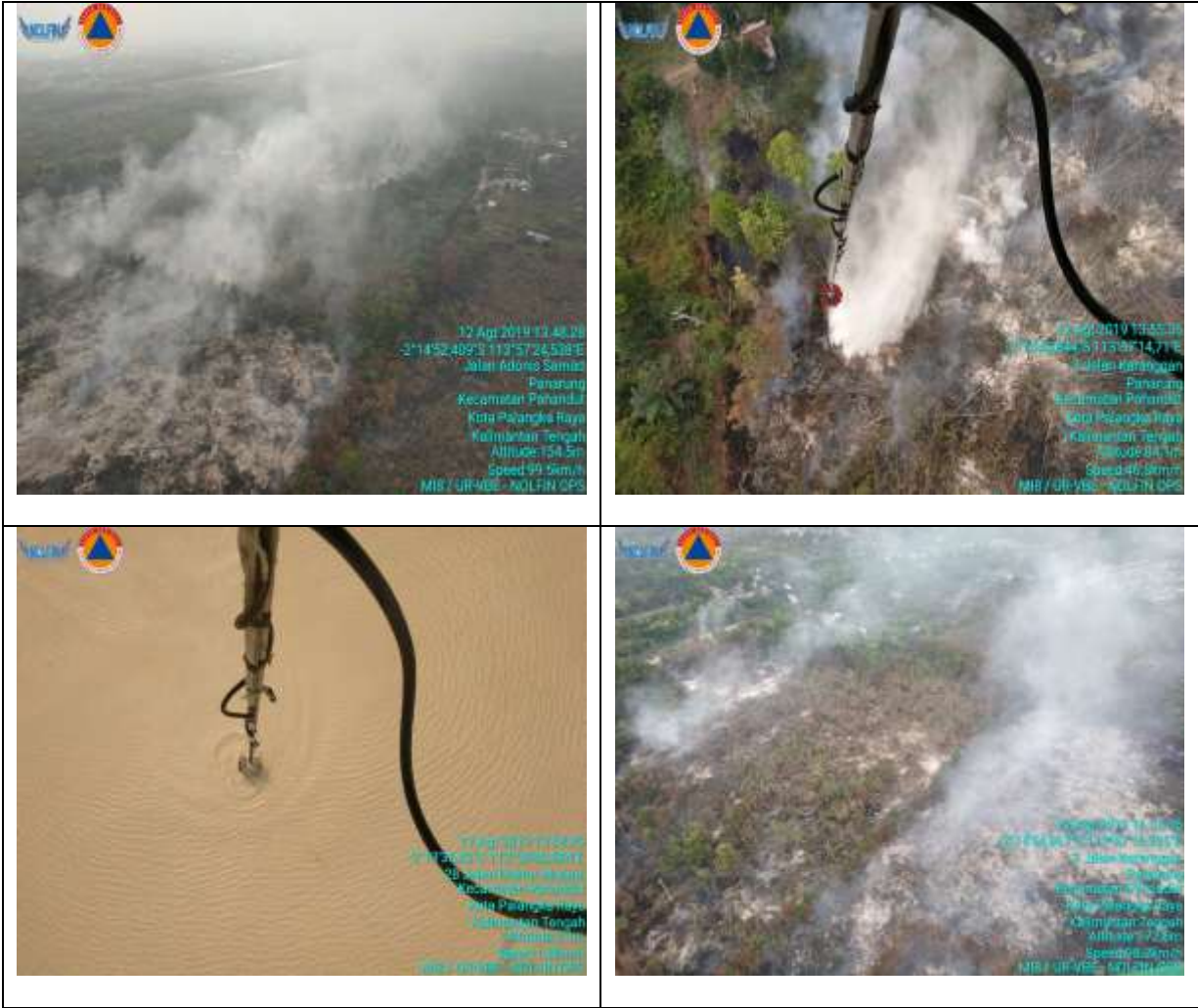
FOTO-FOTO BEFORE DAN AFTER