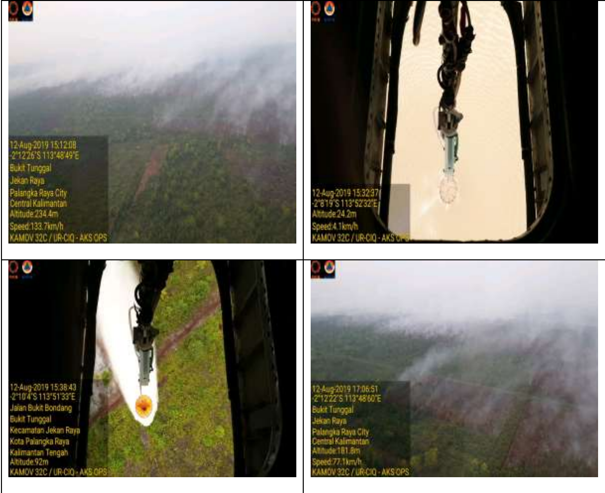
FOTO-FOTO BEFORE DAN AFTER