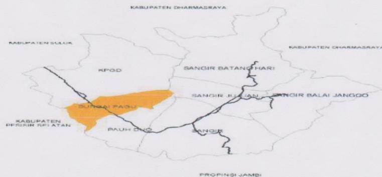
Gambar 2. Peta Administrasi Kecamatan Sungai Pagu

Potensi sumber daya alam yang dimiliki oleh Kecamatan Sungai Pagu dari aspek demografi penduduk Kecamatan Sungai Pagu berjumlah \pm 30.366 jiwa, terdiri dari Laki-laki berjumlah 14.735 jiwa dan Perempuan berjumlah 15.631 jiwa. Strata pendidikan penduduk Kecamatan Sungai Pagu terdiri dari tidak/belum Sekolah 1.295 jiwa, Tidak tamat SD 5.975 jiwa, Pendidikan SD 6.686 jiwa, Pendidikan