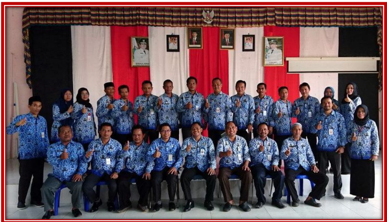
FOTO BERSAMA PEGAWAI KANTOR KECAMATAN SUNGAI LOBAN SEKRETARIS DESA, PLKB, SI2APD