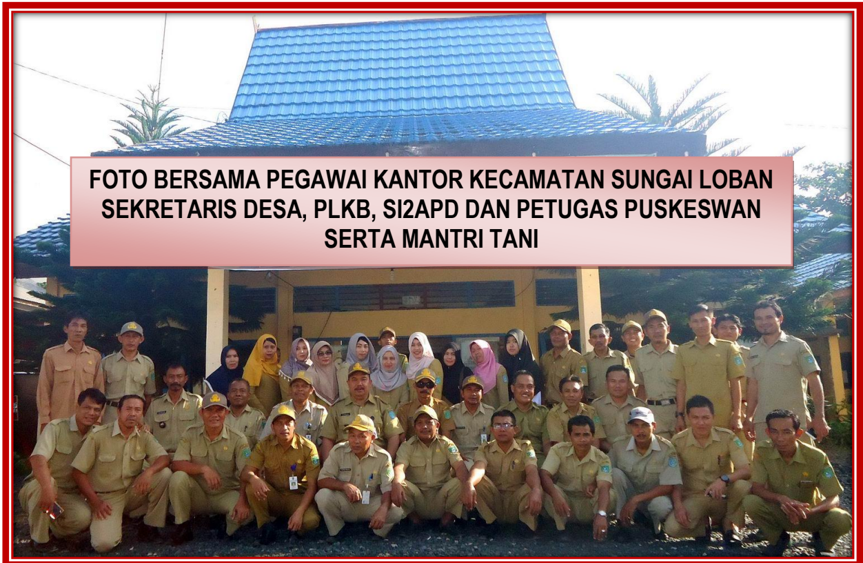
FOTO BERSAMA PEGAWAI KANTOR KECAMATAN SUNGAI LOBAN SEKRETARIS DESA, PLKB, SI2APD DAN PETUGAS PUSKESWAN SERTA MANTRI TANI

Website : www.sungailoban.tanahbumbukab.go.id