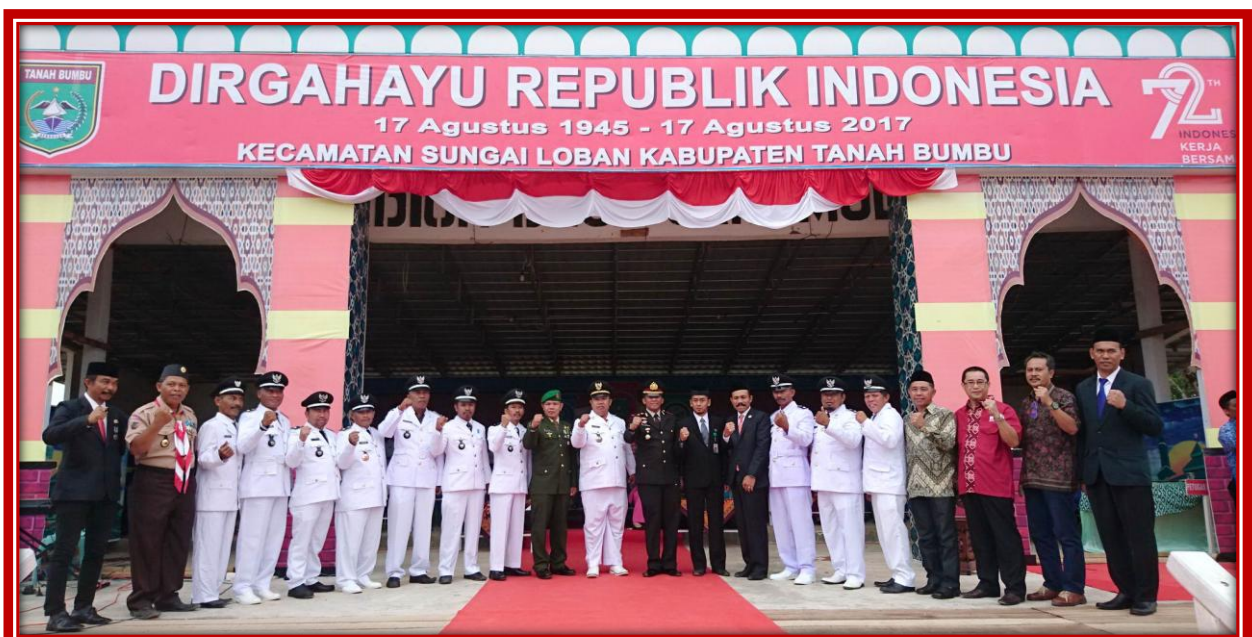
FOTO BERSAMA CAMAT SUNGAI LOBAN BERSAMA UNSUR MUSPIKA DAN PARA KEPALA DESA PADA PERINGATAN HUT RI KE-72 DI KECAMATAN SUNGAI LOBAN TAHUN 2017