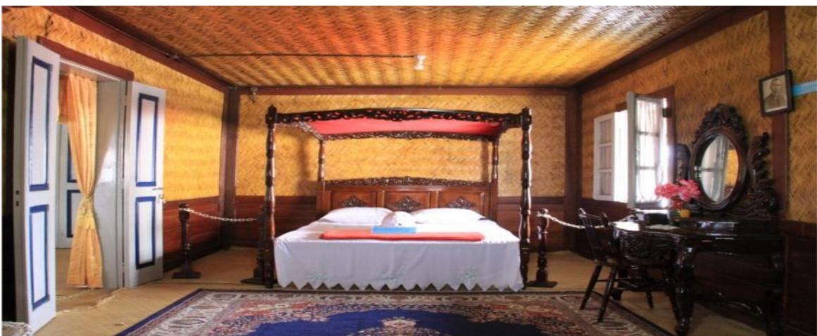
Biliak (kamar) Pak Gaek. Pak Gaek merupakan panggilan Bung Hatta terhadap kakek beliau. Kamar ini terletak di seberang kamar Ibunda Bung Hatta. Pada kamar ini terdapat satu dipan (ranjang) dan satu lemari.