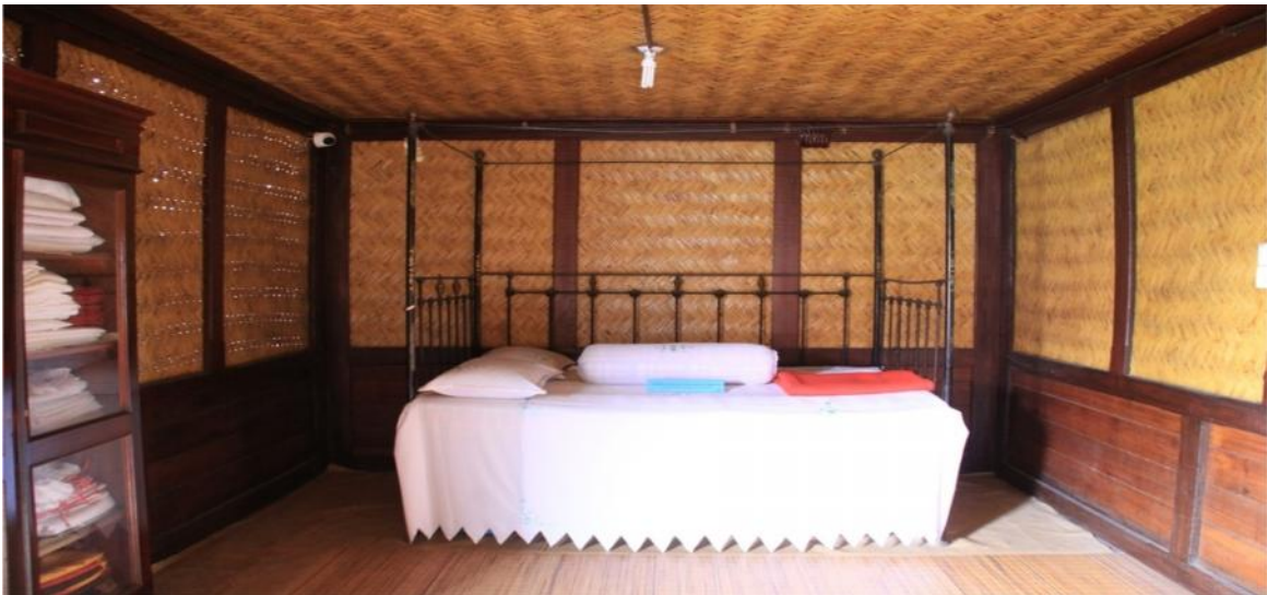
Biliak (Kamar) Ibunda Bung Hatta terletak di lantai dua terdapat satu dipan (ranjang), lemari dan meja hias. Di kamar inilah Bung Hatta dilahirkan oleh Sang Ibunda.