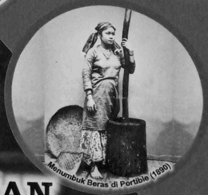
Menumbuk Beras di Portible (1890)

Mobil Seberat Satu Ton Yang Akan Diseberangkan di Batang Panel Sekitar Tahun 1935