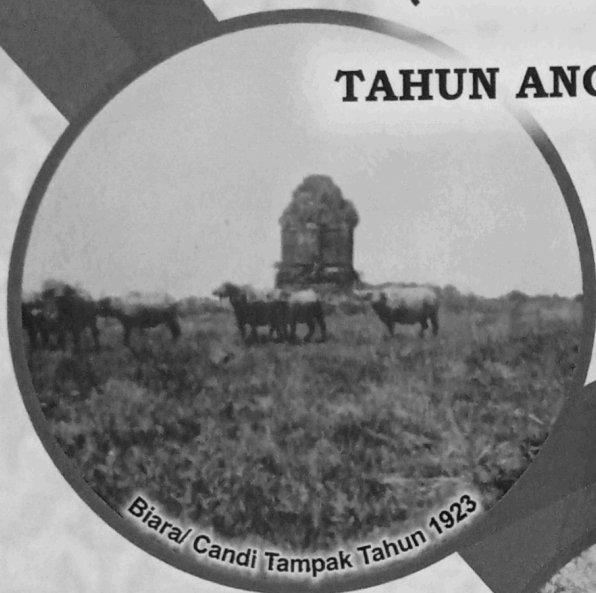
Biara/ Candi Tampak Tahun 1923