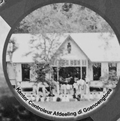
Kantor Controleur Afdeeling di Goenoengtoea