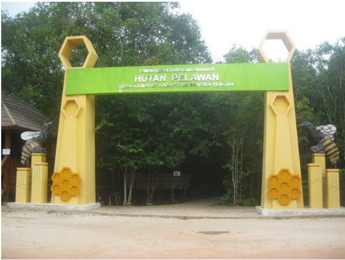
Ket. Foto salah satu objek Wisata Hutan Pelawan Desa Namang