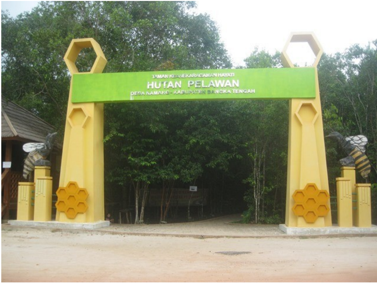
Ket. Foto salah satu objek Wisata Hutan Pelawan Desa Namang