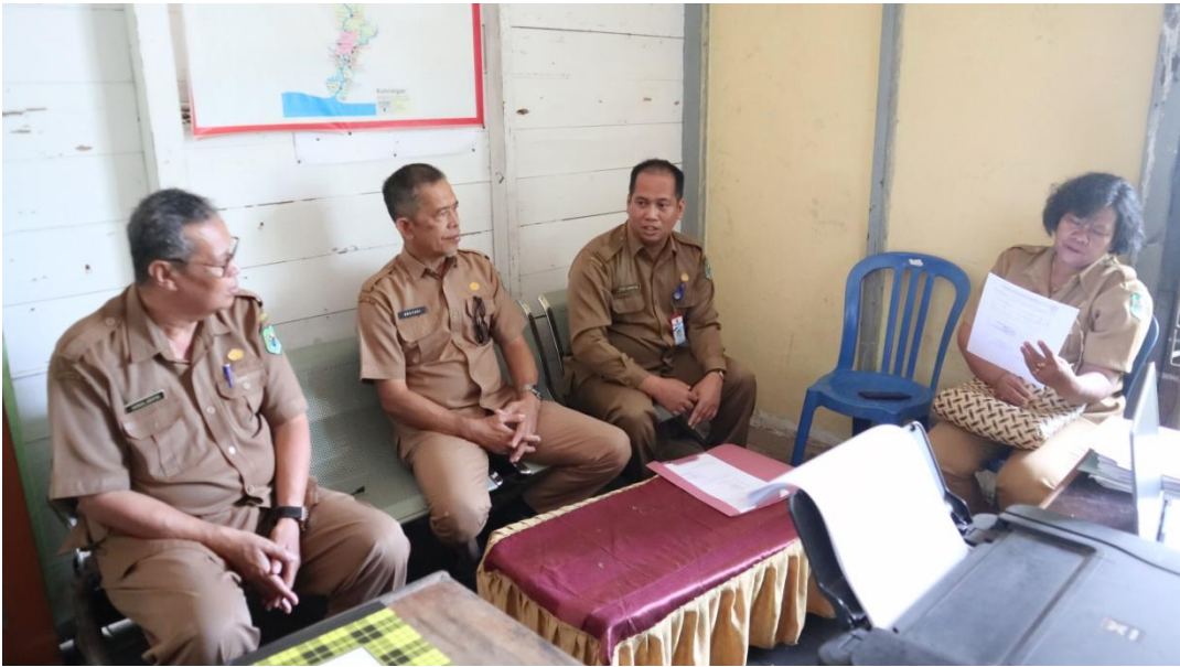
Kecamatan Kapuas Barat