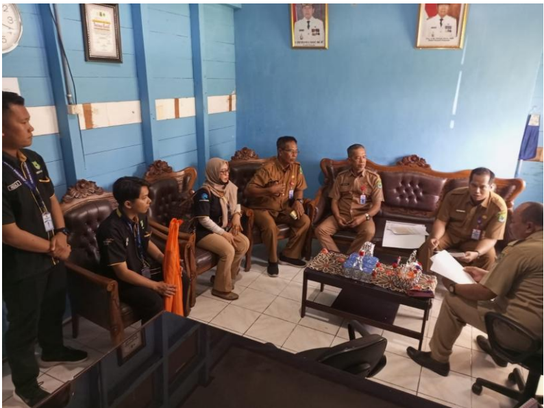
Kecamatan Kapuas Hilir