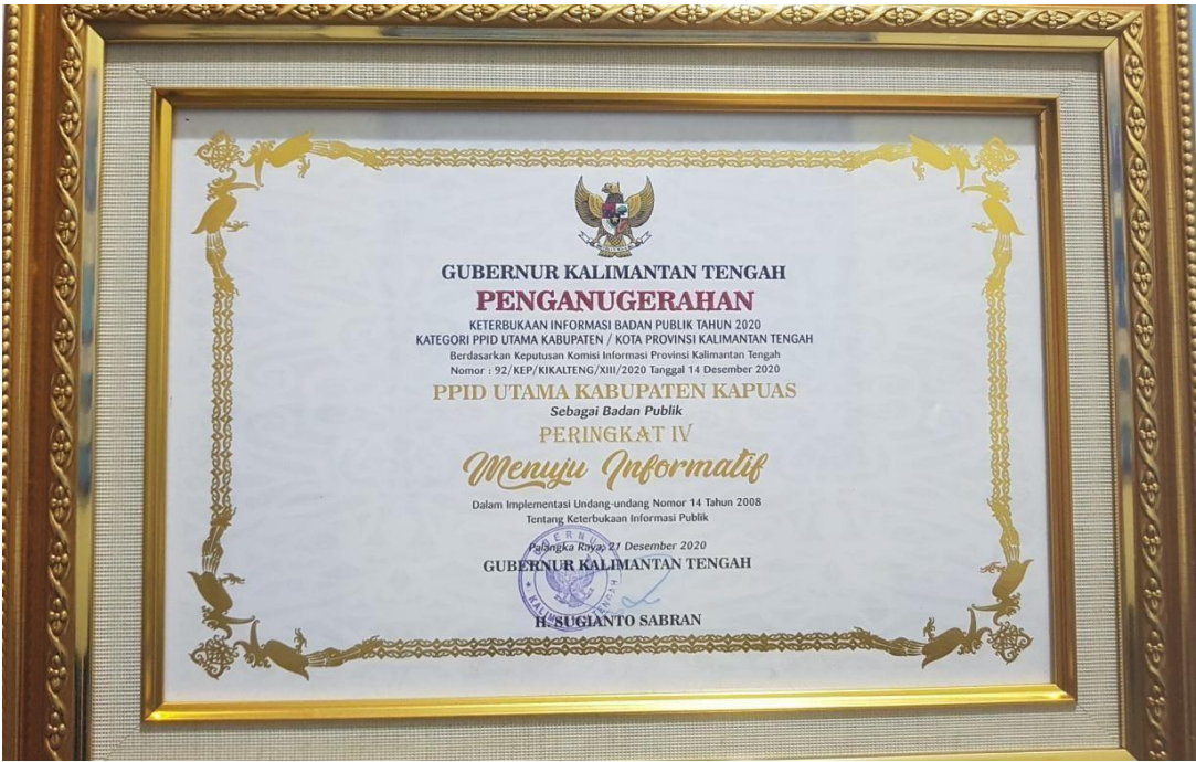
Piagam Penghargaan Tahun 2020 “Menuju Informatif”