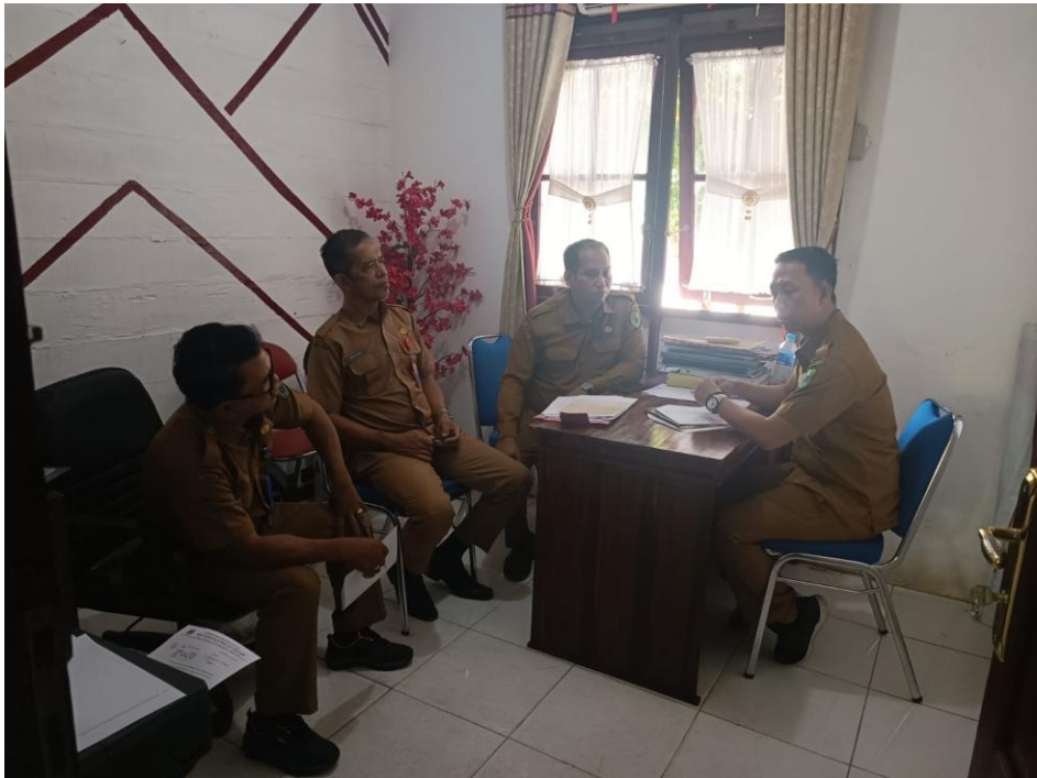
Kecamatan Pulau Petak