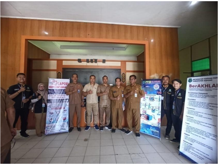
Kecamatan Kapuas Timur