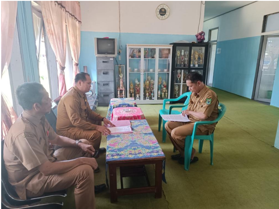
Kecamatan Kapuas Murung