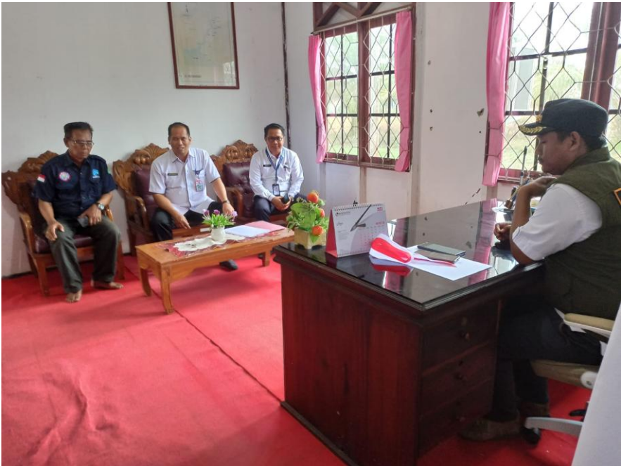
Kecamatan Kapuas Kuala