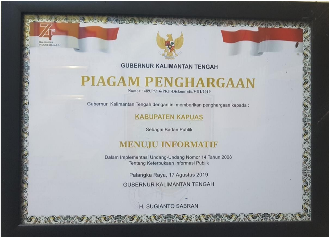
Piagam Penghargaan Tahun 2019 “Menuju Informatif”