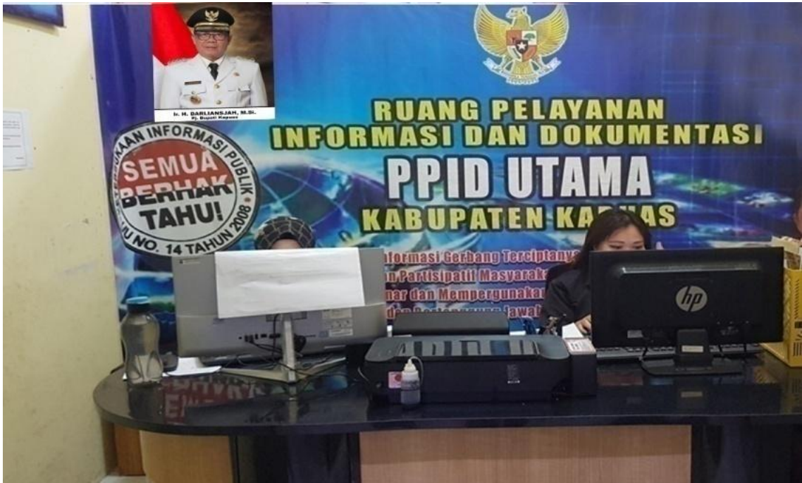
Gambar 2.2.Ruang Pusat Layanan Informasi Diskominfo