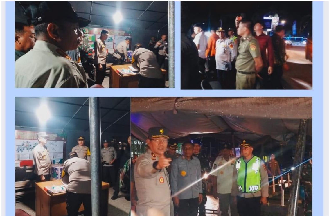
Foto kegiatan Patroli bersama Forkopimda dalam rangka Pemantauan dan Pengecekan Pos Pengamanan Malam Pergantian Tahun