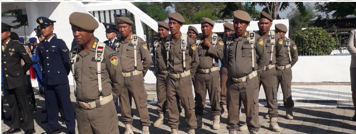
Foto kegiatan melaksanakan Upacara Peringatan Hari Pahlawan di Taman Makam Pahlawan Darma Loka Kupang