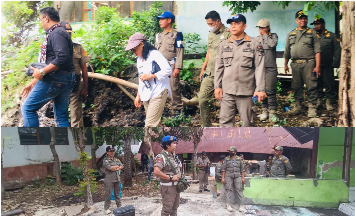
Foto kegiatan Pengamanan pembongkaran Mess Pegawai RSUD Prof. Dr. WZ. Johannes Provinsi NTT