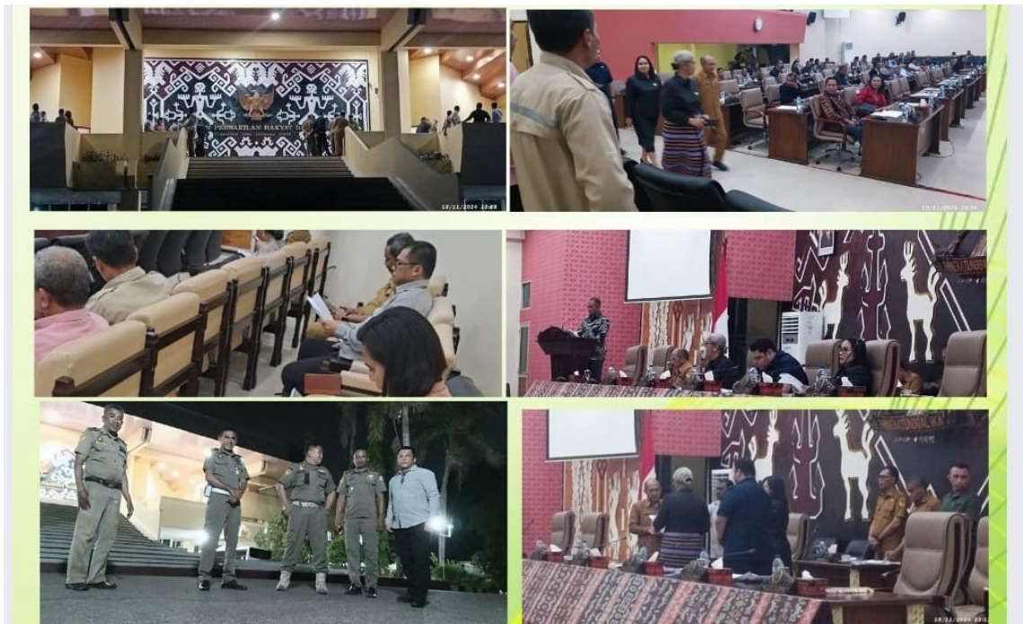
Foto kegiatan pengamanan dan menghadiri Rapat Paripurna Terhadap Rancangan Anggaran Pendapatan dan Belanja Negara Provinsi NTT TA.2025