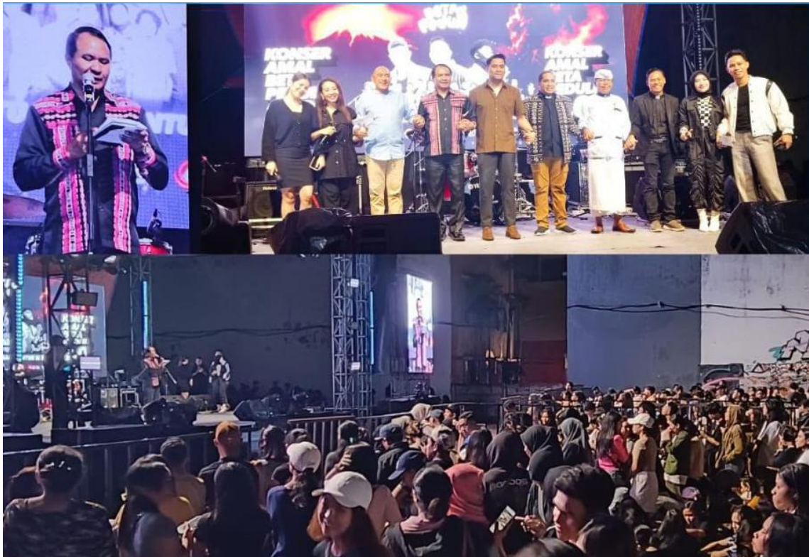
Foto kegiatan menghadiri dan memberikan sambutan Pj.Gubernur NTT diwakili oleh Plt.Kasat PolPP Provinsi NTT pada acara Konser Amal Beta Peduli 2.0 di Waterpark Kupang