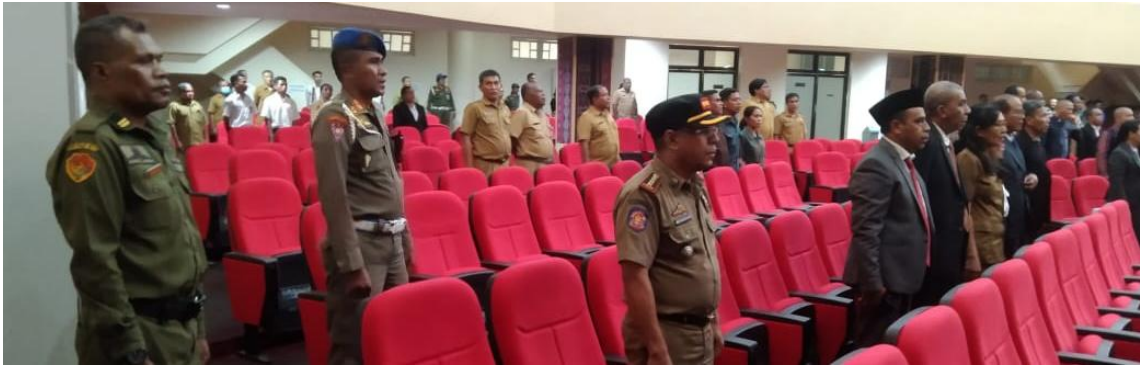
Foto kegiatan pengamanan pelantikan Penjabat Bupati Nagekeo oleh Pj.Gubernur NTT di Aula El Tari Kantor Gubernur NTT