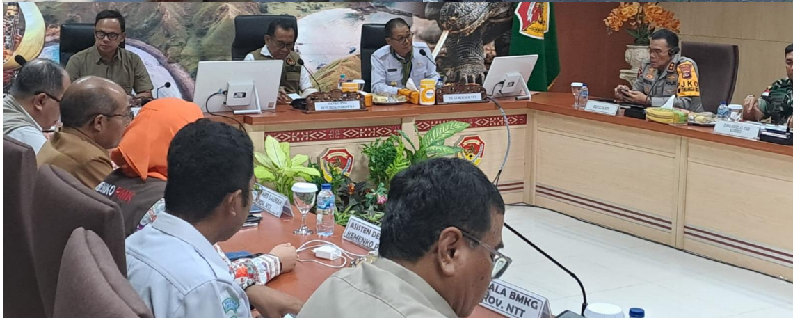
Foto kegiatan pengamanan kegiatan Rapat Koordinator Kunjungan Menteri di Gedung Sasando Kantor Gubernur NTT