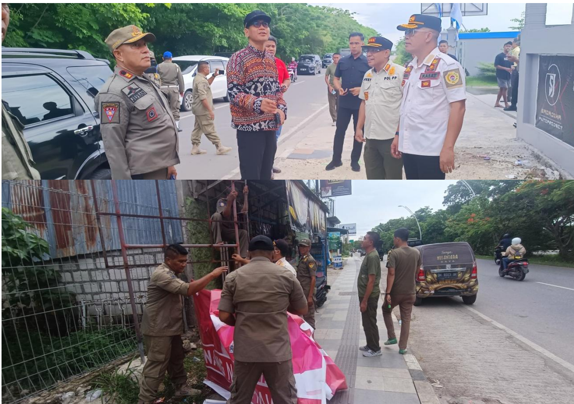
Foto kegiatan penurunan dan pembongkaran baliho di sepanjang jalan Kota Kupang