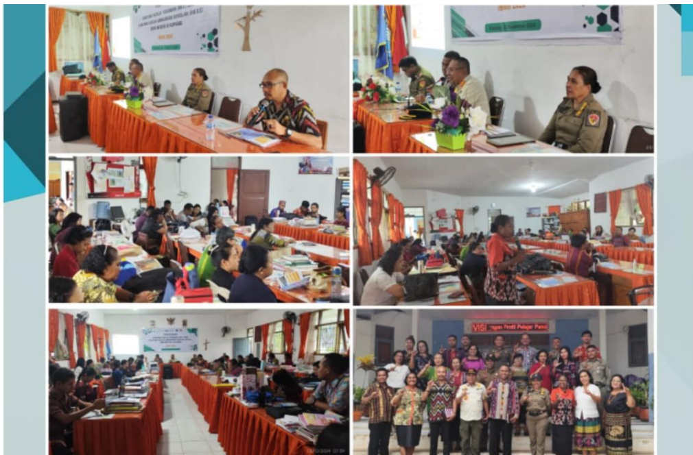
Foto kegiatan Sosialisasi dan Penyuluhan Layanan Dasar Dampak Perda dan Perkada di SMA Negeri 6 Kota Kupang