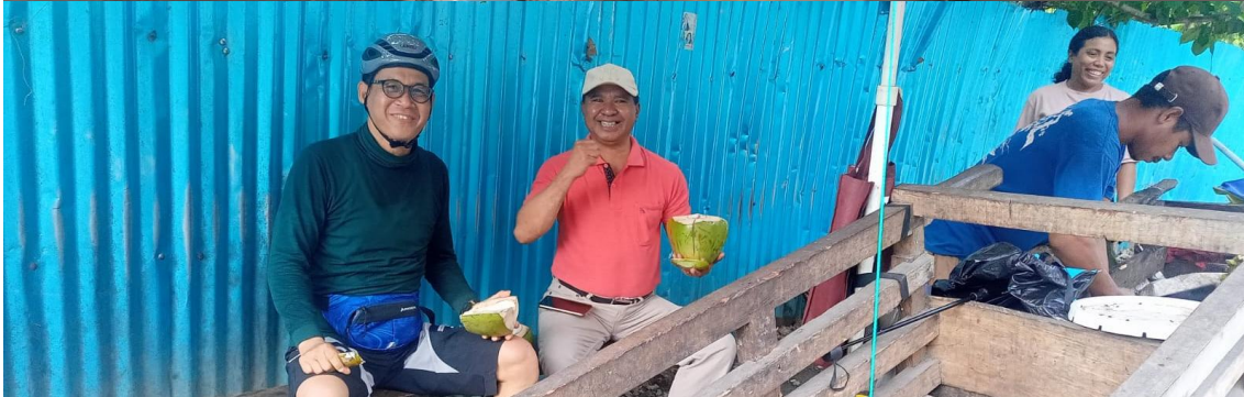
Foto kegiatan Pengawalan Pj.Gubernur bersepeda di seputaran Kota Kupang