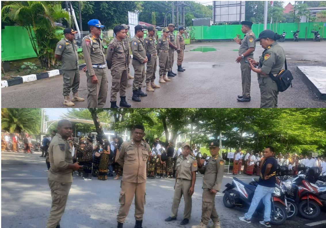
Foto kegiatan Pengamanan Parade Budaya