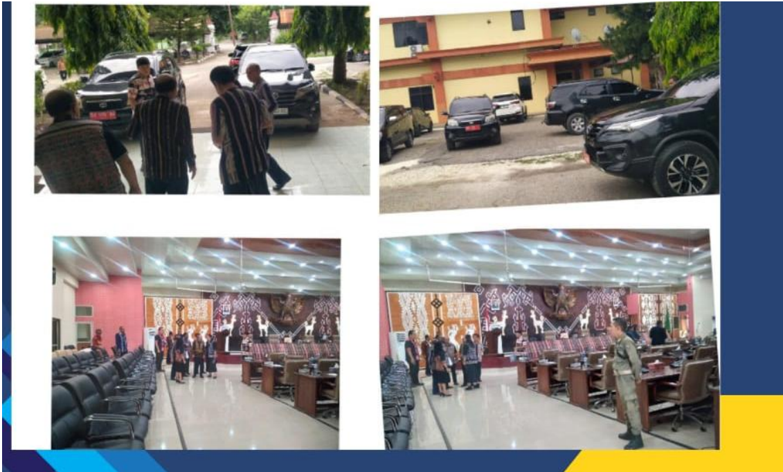
Foto kegiatan Pengamanan Rapat Paripurna DPRD Provinsi NTT