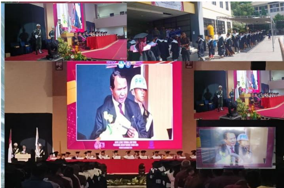
Foto kegiatan sambutan Pj.Gubernur NTT yang diwakili oleh Kasat Pol PP Provinsi NTT dalam kegiatan Wisuda Magister Terapan, Sarjana Terapan dan Ahli Madya Politeknik Negeri Kupang