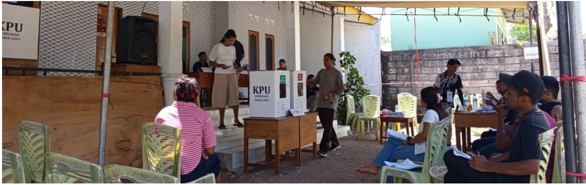
Foto kegiatan pengamanan Pemilu di TPS-TPS di Kota Kupang