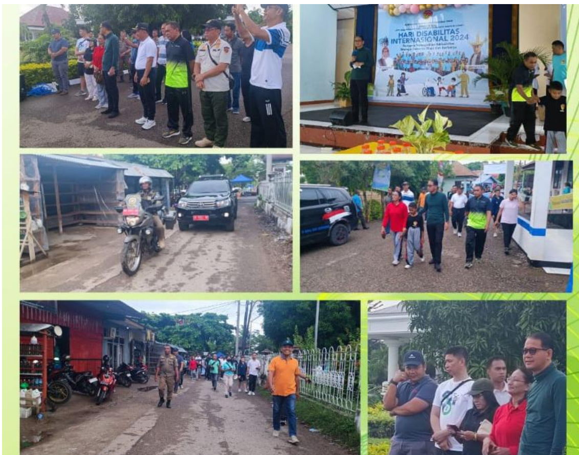
Foto kegiatan Pengamanan dan Pengawasan dalam rangka Hari Disabilitas Internasional 2024