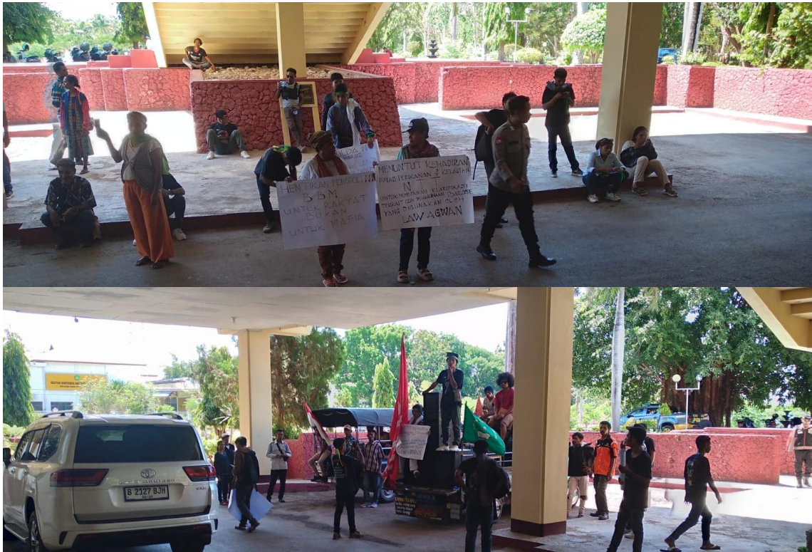
Foto kegiatan pengamanan demo oleh Aliansi Liga Mahasiswa Indonesia Untuk Demokrasi di depan Kantor DPRD Provinsi NTT