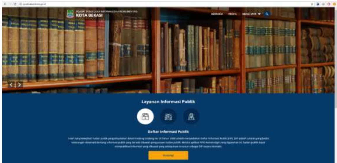
Halaman Beranda SIP PPID Kota Bekasi