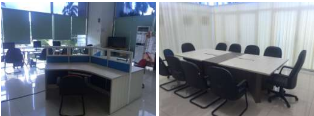
Foto Ruang dan Loker Layanan PPID Utama